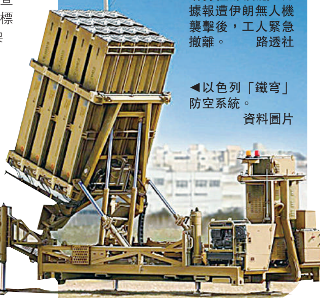
◀以色列「鐵穹」防空系統。資料圖片