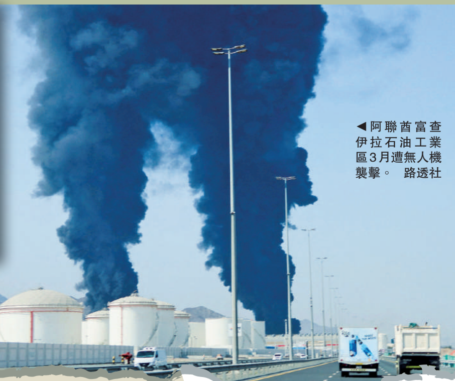
◀阿聯酋富查伊拉石油工業區3月遭無人機襲擊。

以色列總理辦公室13日稱，內塔尼亞胡此次訪問阿聯酋，促成以色列和阿聯酋外交關係「歷史性突破」。這是內塔尼亞胡首次公開證實訪問阿聯酋。以色列與阿聯酋於2020年宣布實現外交關係正常化。