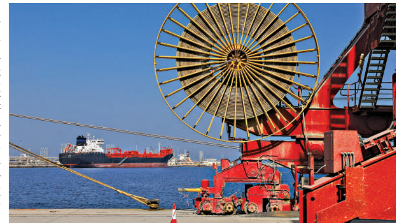
►一艘油輪停靠在阿聯酋富查伊拉港。