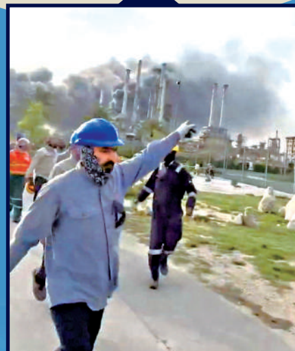
▲沙特阿美旗下位於沙特東部的拉斯塔努拉煉油廠3月遭無人機襲擊後，工人緊急撤離。