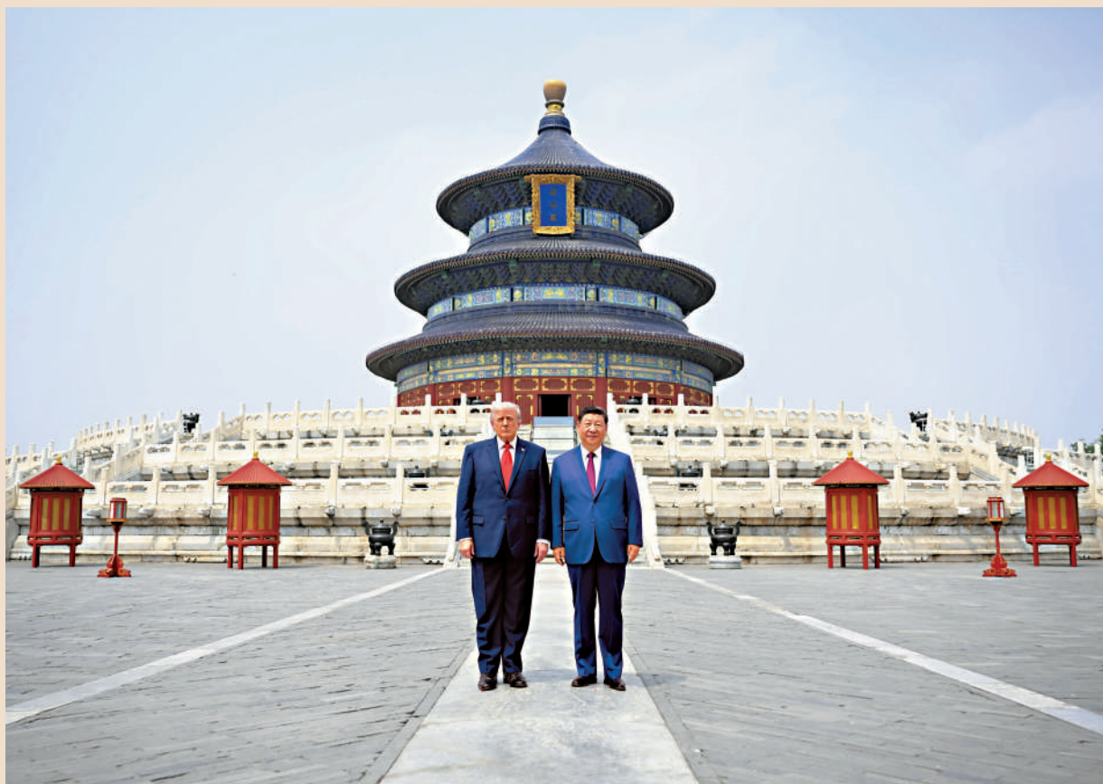
▲5月14日，國家主席習近平同來華進行國事訪問的美國總統特朗普參觀天壇。