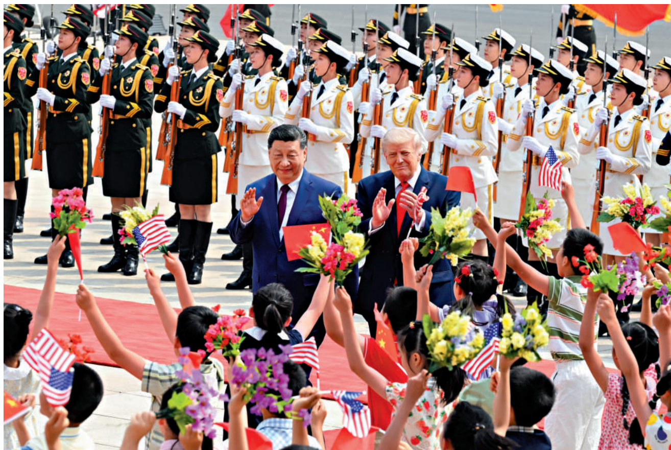
▲14日上午，國家主席習近平在北京人民大會堂同來華進行國事訪問的美國總統特朗普舉行會談。會談前，習近平在人民大會堂東門外廣場為特朗普舉行歡迎儀式。