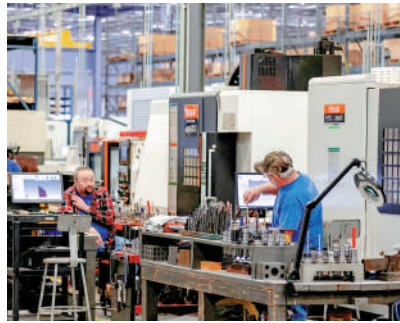
▲去年美國製造業回流指數出現小幅回升，但仍處於負值區間。

造業的經濟支柱性地位逐漸讓位於服務業。2008年金融危機爆發後，聯邦政府意識到產業結構「空心化」問題的嚴重性，密集出台了一系列扶持政策，但效果並不顯著。到了2009年，時任美國總統的奧巴馬首次提出要把「重振製造業」作為重要經濟戰略。2017年，特朗普進一步強化了製造業重振計劃，對外公布《製造業就業主動性計劃》。拜登履職後，產業鏈安全議題也被提升至關鍵位置，並於2022年相繼通過了《通脹削減法案》與《2022年芯片與科學法案》。2025年，特朗普二次入主白宮後立即發動貿易戰2.0，全面加徵進口關稅。