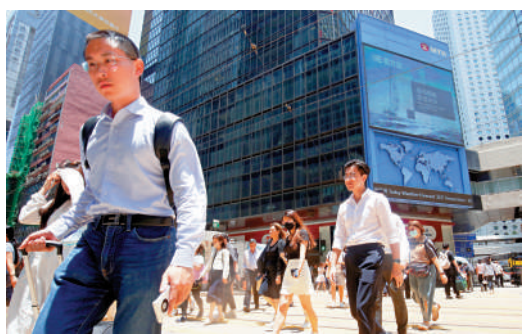
▲隨着香港經濟復甦,商業房地產有望逐步回穩。

晶表示,香港的商業房地產仍未完全走出困境,但隨着宏觀環境逐步改善,市場大概已走過最艱難的階段。她指出,在香港更強的經濟基本面支持下,商業房地產的回穩與復甦可望逐步展開,但全面修復仍需時間。