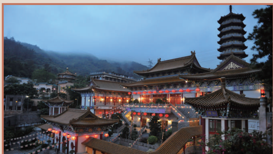
▲重建後的西方寺清淨莊嚴。