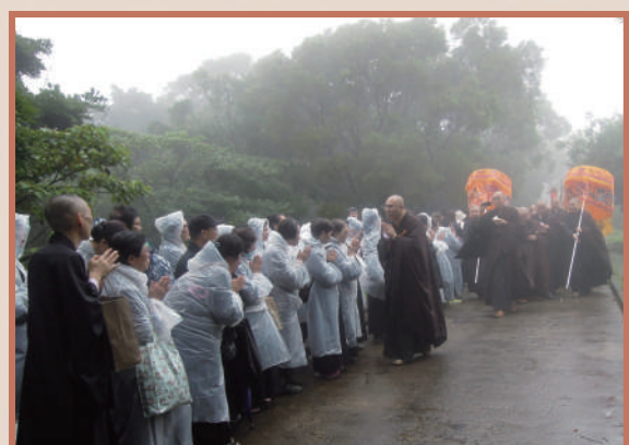
▲海內外信眾冒雨恭送永惺長老最後一程。