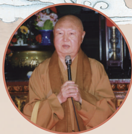
▲永惺長老在上海玉佛寺隨緣開示。

香江流水，日月不居。今年是天台宗第四十五代教觀總持、香港佛教僧伽重要領袖、西方寺開山方丈永惺長老圓寂十周年。香江潮水十年往復，芙蓉山木十度枯榮。但西方寺晨鐘暮鼓悠長的餘韻在山間回響時，彷彿在訴說：澎湃潮聲裏有永惺長老無量的誓願，斑斕年輪中有永惺長老不滅的足跡。那位端坐輪椅、眉凝霜雪、面龐飽滿、目含悲智的長者，其實從未走遠，他以一生修行，完成了對生命本質、佛法真諦、世間大義的終極叩問與踐行，留下了穿越時空的無盡回響。 文：史利偉