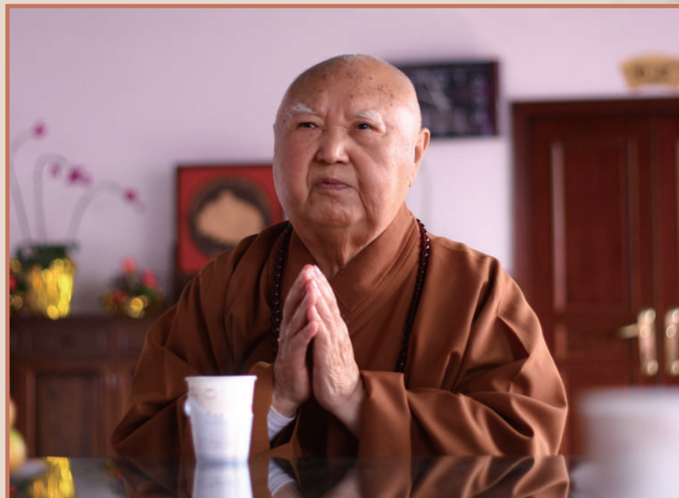
▲慈悲莊嚴的永惺長老。

香江流水，日月不居。今年是天台宗第四十五代教觀總持、香港佛教僧伽重要領袖、西方寺開山方丈永惺長老圓寂十周年。香江潮水十年往復，芙蓉山木十度枯榮。但西方寺晨鐘暮鼓悠長的餘韻在山間回響時，彷彿在訴說：澎湃潮聲裏有永惺長老無量的誓願，斑斕年輪中有永惺長老不滅的足跡。那位端坐輪椅、眉凝霜雪、面龐飽滿、目含悲智的長者，其實從未走遠，他以一生修行，完成了對生命本質、佛法真諦、世間大義的終極叩問與踐行，留下了穿越時空的無盡回響。 文：史利偉