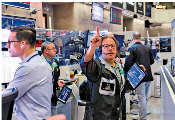
▲油價飆升點燃市場對通脹擔憂，美股三大指數全線向下。

美股三大指數上周五全面下挫。道指跌1.07%，收報49526點，全周挫0.17%，結束兩周升勢；標指單日跌1.24%，報7408點，全周仍錄得0.13%升幅，並連升7周；納指單日跌幅最大，收挫1.54%，報26225點，全周輕微回落0.08%，終止6周升勢。美銀認為，通脹壓力正對美國產生廣泛影響，且後續或有一系列事件加劇市場謹慎情緒，料下月初迎來獲利回吐的窗口期。