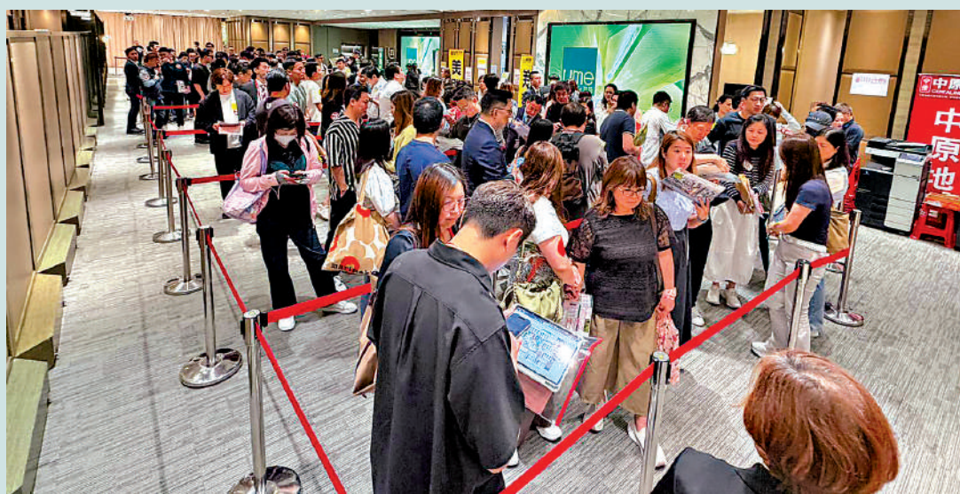
形璿昨日次輪開賣121伙又告搶清。

瑞銀預期今年全年本港樓價上升5%至10%，主要受惠人才流入、學生需求、移民回流潮三大因素；而標普預計全年樓價上升8%至10%，認為未來兩年本港樓市將進入溫和復甦階段。