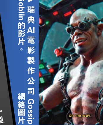
瑞典AI電影製作公司Gossip Goblin的影片。網絡圖片