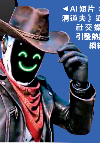
AI短片《喪屍清道夫》近期在社交媒體上引發熱議。網絡圖片