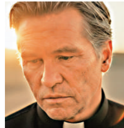
▲已故男星韋基馬通過AI技術「出演」獨立電影。網絡圖片

全球獎主辦方5月8日正式公布時程與最新規則，最受矚目的是首次針對AI使用訂出明確規範。主辦方強調，作品使用生成式AI並不會自動失去參賽資格，但「人類創意主導」仍必須是核心原則。演員類獎項方面，特別強調必須主要來自演員本人的表演，若大量使用AI技術，則不具備參賽資格。不過，若AI僅作為