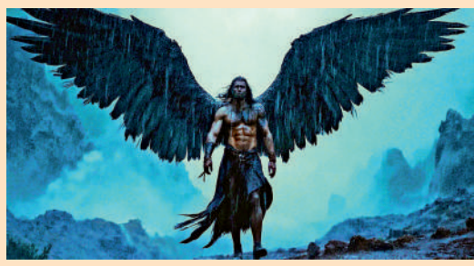
▲亞馬遜旗下的Prime Video平台熱門影集《大衛王朝》使用AI技術降低成本。

今年2月，德國專業AI影片製作公司Dor Brothers發布了長達3分鐘的全AI最新科幻短片作品，引發廣泛關注。該工作室稱，影片在視覺效果與規模上可媲美一部耗資2億美元(約15.6億港幣)的荷里活製作電影，完全由AI在一天內生成。網上對影片反應正負評價參半，有觀眾認為場景逼真、轉場流暢及畫面宏大，視覺語言不亞於高成本的災難及科幻片。但也有人指出其偶爾出現的視覺瑕疵，以及敘事深度不足，畫面精緻但故事情節顯薄弱。