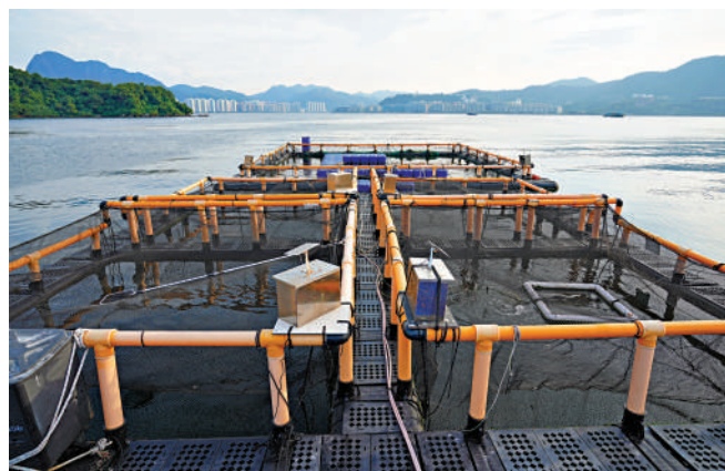
▲有參與「優質養魚場計劃」的漁場表示，會加入政府的統一品牌，相信可令市民對產品更有信心。

「農業持續發展基金」已撥款約1500萬元，資助漁農團體委託香港品質保證局，制定一套為本地漁農產品而設的機制，確保參與計劃的漁農戶遵循漁護署