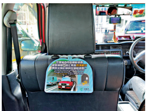
▲的士車廂內會放置標語牌，提醒乘客須繳付全額隧道費。