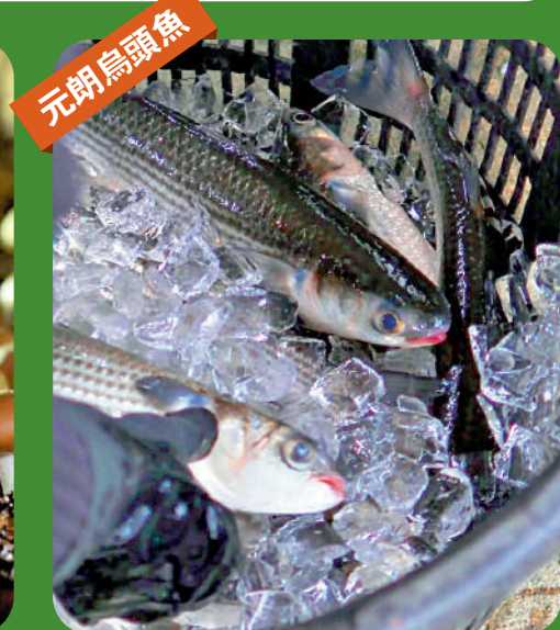
▲漁護署轄下優質養魚場、信譽農場出產多款優質漁農產品，將於7月納入全新的統一品牌，加強推廣。