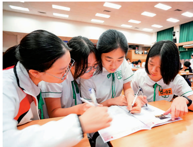
國情知識大賽港島區複賽昨日舉行，近500名學生同場應試。