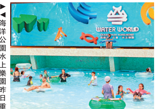
開關，雖然天氣不穩定，仍有逾千入場體驗。