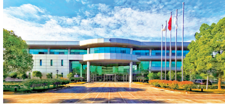
▲華虹近日借勢調整，相信調整過後仍有力再上，建議候105元買入，目標價128元。

港股黑期（恒指外圍期貨）於約25600點上落，較上周五低近300點，預示恒指周一持續偏軟。證券業人士認為，AI相關板塊可趁調整收集，其中季績強勁的華虹半導體（01347）值博，另可留意南方科創板50（03109）ETF，捕捉A股機遇。