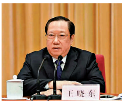
▲湖北原省長王曉東。

2017年1月起，王曉東出任湖北省省長，直至2021年5月請辭省長職務，並於隔月出任十三屆全國政協農業和農村委員會副主任。2023年3月，他擔任十四屆全國政協常委、農業和農村委員會副主任，至此番被查。