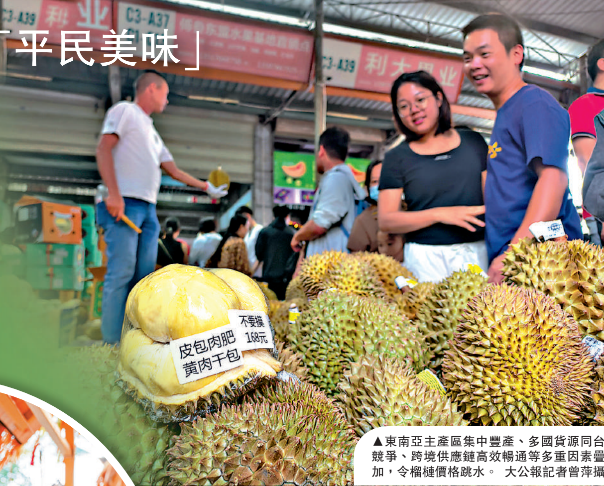
▲東南亞主產區集中豐產、多國貨源同台競爭、跨境供應鏈高效暢通等多重因素疊加，令榴槤價格跳水。

如果把時間撥回2024年，榴槤還是讓普通消費者需要掂量一下的「奢侈水果」。據了解，2024年，泰國金枕零售價普遍在30-40元（人民幣，下同）/斤，品質上乘的A級果更是突破50元/斤，5斤重的榴槤就要花費200多元，只有逢年過節才捨得消費。