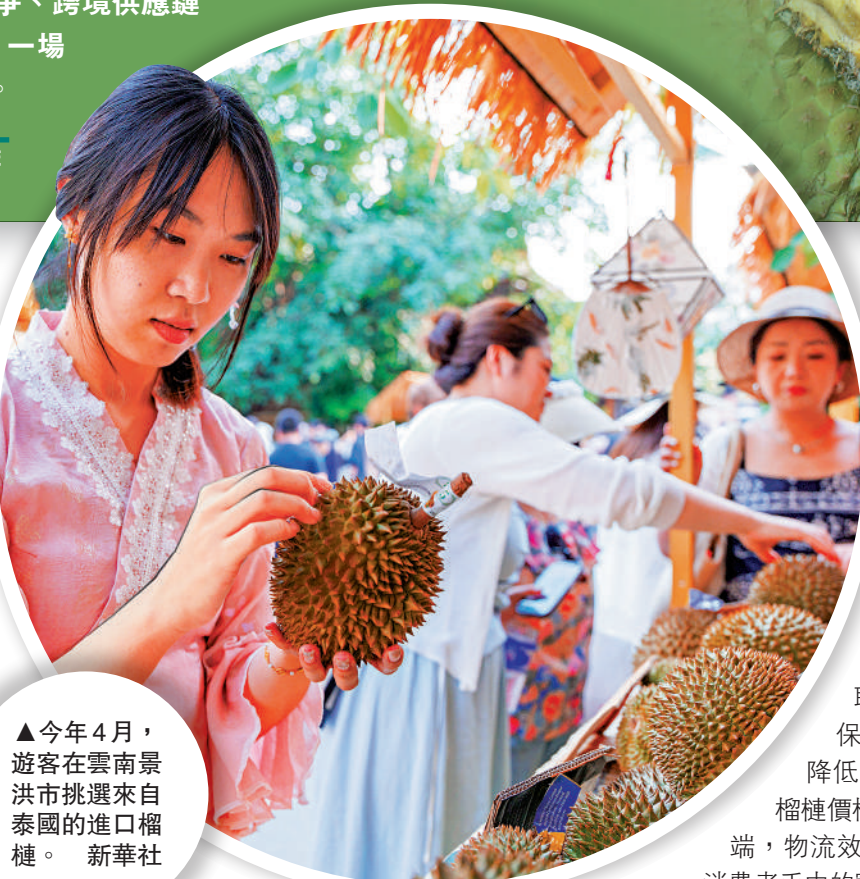
▲今年4月，遊客在雲南景洪市挑選來自泰國的進口榴槤。