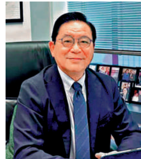
▲林健鋒強調產業園公司會與政府部門保持溝通，反映企業的需求。

立法會財委會早前通過向產業園公司注資100億，被問到連同公司起步的十多人，是否足夠推動產業園發展的規劃。林健鋒表示目前難以判斷，若進展順利，產業園公司還會考慮發行債券等財務工具。對於是否應該由審計署對公司進行審計，林健鋒認為應該由政府決定，但他強調如果程序僵化會降低發展速度，而機制上產業園公司每年都會向立法會報告工作。