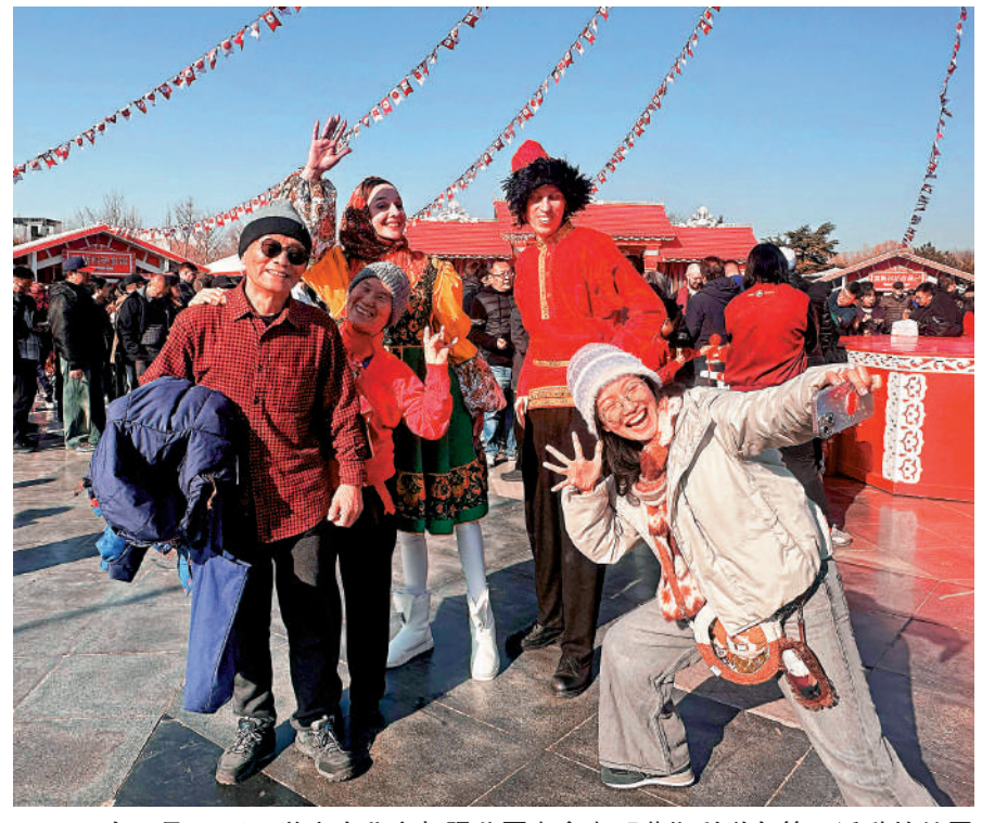
▲2026年2月19日，遊客在北京朝陽公園與參與「莫斯科送冬節」活動的俄羅斯演員互動。