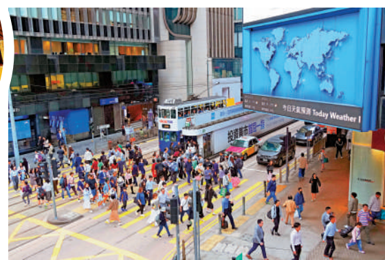
▲投資署今年已協助310多間企業落戶香港或在港擴充業務。

中美元首近日會面並同意建立建設性戰略穩定關係，劉凱旋指，自中美貿易戰及中東戰事以來，國際經貿秩序已經轉變，目前市場估計未來一段時間中美可保持穩定關係，企業或可「啱返口氣」。不過，能源價格高企，的確會影響運輸及中小企業營運成本，始終不利全球經濟，而香港要穩中求勝，亦要把握機遇。