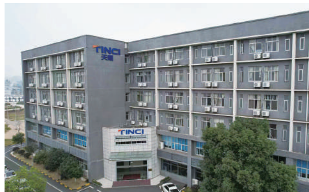
▲廣州天賜高新材料落戶九江19年，已成長為全球鋰電池電解液行業龍頭，出貨量連續11年全球第一。

東江水被譽為「生命水、政治水、經濟水」，自江西贛州發源，奔流南下，成為粵港澳大灣區4000多萬同胞的生命之源，保障了香港居民近八成的淡水需求。江西素來是生態環境的「優等生」，始終像守護自身生命一般守護着青山綠水。