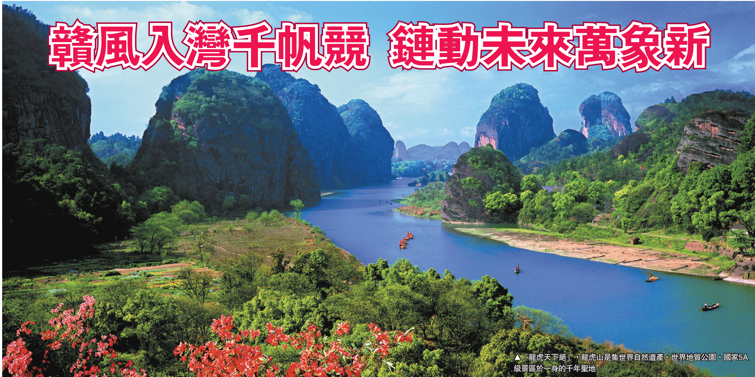
▲「龍虎天下絕」，龍虎山是集世界自然遺產、世界地質公園、國家5A級景區於一身的千年聖地。

粵港澳大灣區是中國開放程度最高、經濟活力最強的區域之一，也是江西開展經貿、金融、科技創新等領域合作的重要夥伴。為全面深化合作，提升對內對外開放水平，江西省委、省政府決定於今年5月中下旬，在廣東、香港、澳門等地舉辦2026年江西—粵港澳大灣區經貿活動周。