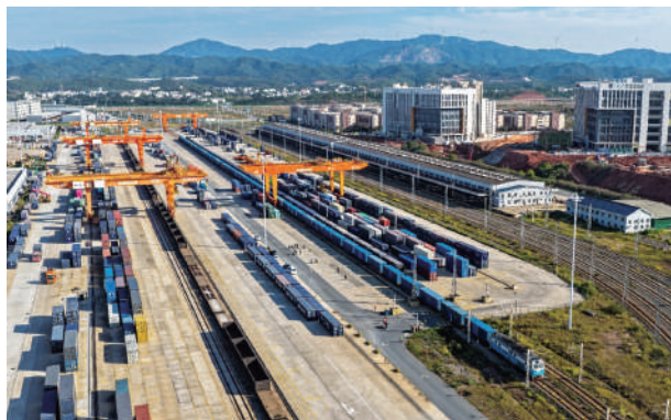
▲「贛深組合港」在全國首創「跨省、跨開區、跨陸海港」通關一體化，實現「一次申報、一次查驗、一次放行」。