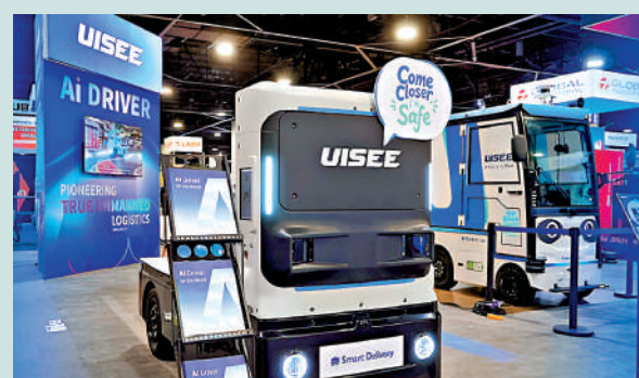
▲今日有兩隻新股掛牌。拓璞數控(上圖)暗盤錄得約五成升幅。馭勢科技(下圖)則表現疲軟。

【大公報訊】渣打(02888)在投資日公布，計劃2030年前裁減至少15%的後勤與企業職能人力。以目前超過5.1萬至5.2萬名後勤員工估算，約有近8000人可能受到影響。渣打表示，希望透過AI取代部分「低價值人力工作」，藉此精簡營運、提升獲利能力，同時強化財富管理等高利潤業務布局。