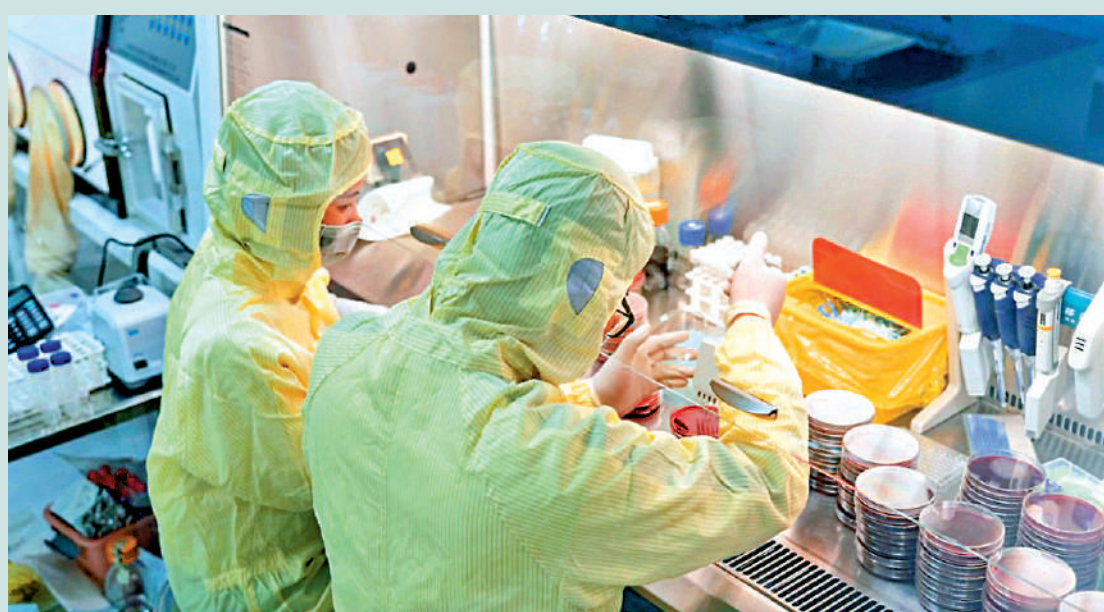
▲丹諾醫藥部分藥品即將商業化，且與其他藥企形成差異化路線，令市場對公司收入前景有良好預期。

分化，輝立暗盤最高漲37.6%，收市升幅收窄至0.08%，報60.35元，每手賬面賺2.5元；富途和耀才則收市轉跌，跌幅逾1%，每手賬面分別虧損37.5元和50元。