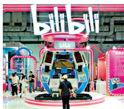
▲B站首季廣告收入按年增長30%。

首席財務官樊欣表示，將繼續在保持盈利的同時，以審慎的方式進行AI相關投入。他續說，AI投入帶來的積極