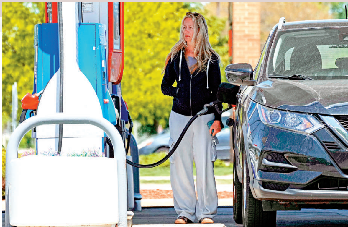
▲美國對伊朗開戰導致全美汽油價格漲。圖為一名女子在伊利諾伊州一間加油站給車輛加油。

針對近日中東局勢及阿聯酋核電站遇襲等問題，中國外交部發言人郭嘉昆19日表示，中方對阿聯酋核電站相關設施遭受襲擊深表關切，反對武裝攻擊和平核設施。中方始終認為，中東海灣各國主權、安全和領土完整都應得到切實尊重，平民和非軍事目標應當得到保護。當務之急是立即全面停火止戰，防止戰火進一步蔓延。