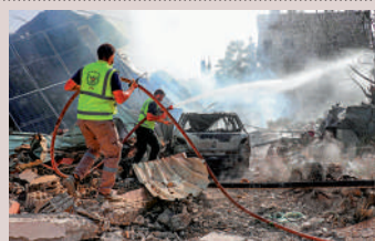
▲以色列持續轟炸黎巴嫩南部村莊，救援人員正在滅火。