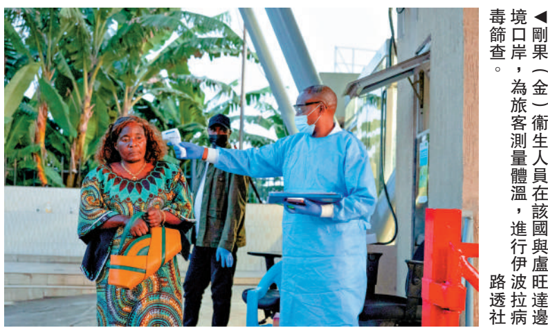
▲剛果（金）衛生人員在該國與盧旺達邊境口岸，為旅客測量體溫，進行伊波拉病毒篩查。

此外，美國科羅拉多州日前發現一例本地感染漢坦病毒死亡病例，羅馬尼亞亦錄得一宗確診漢坦病毒病例，上述兩宗病例都與「洪迪厄斯」號郵輪疫情無關。