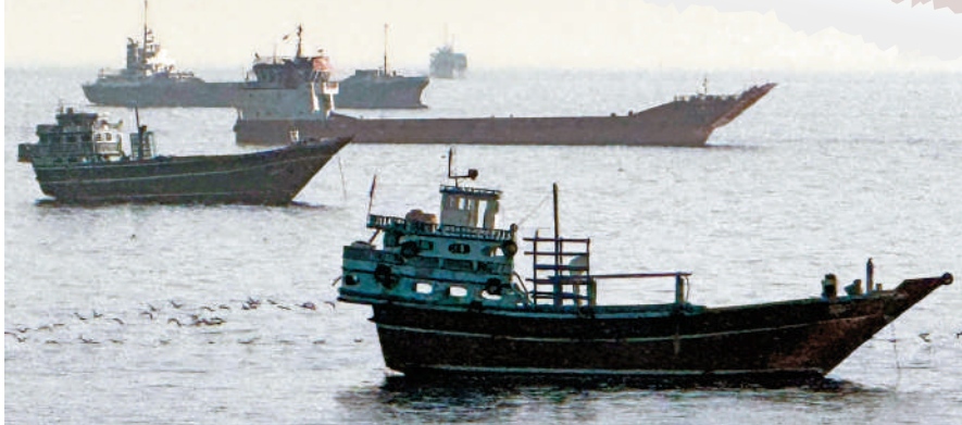
▶船隻停泊在阿曼北部對出的霍爾木茲海峽內。

特朗普18日表示，美國已準備好19日對伊朗發動一次「非常重大」的攻擊，不過，「我把它推遲了一小段時間，希望這也許是永久性的，但也可能只是暫時的。因為我們與伊朗進行了非常重大的討論，將拭目以待這些討論會有何結果」。