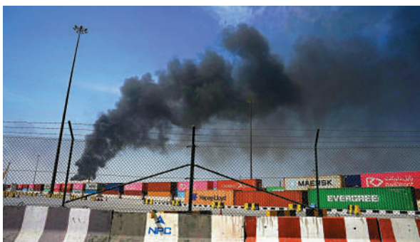
▲海灣國家擔憂美國打擊伊朗導致自己被報復。圖為伊朗無人機3月襲擊阿聯酋迪拜港口地區。

針對特朗普發出的最新軍事威脅，伊朗外交部發言人巴加埃18日表示，德黑蘭不會被嚇倒，同時強調對話與談判進程仍在繼續。伊朗軍方發言人19日指出，如果敵對勢力再