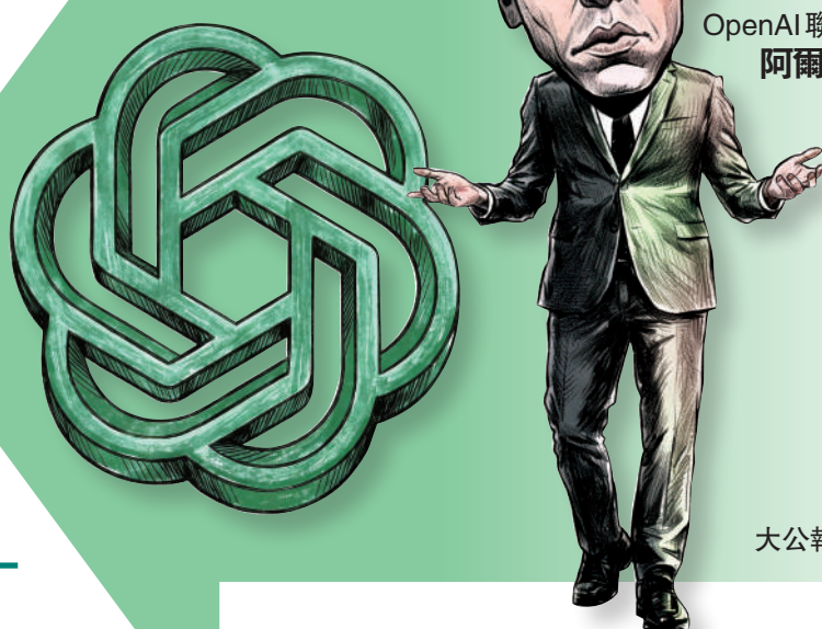
OpenAI聯合創始人阿爾特曼