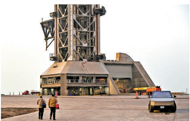
▲SpaceX計劃在上市之前發射第三代星艦運載火箭。

【大公報訊】據法新社報道：華爾街未來幾個月將迎來「超級IPO（首次公開募股）」浪潮，太空探索技術公司（SpaceX）、人工智能（AI）巨頭OpenAI和Anthropic預計將接連宣布上市。其中馬斯克旗下的SpaceX預計將於6月12日登陸納斯達克，尋求募資約750億美元，創史上最大規模IPO紀錄，公司市值則可能達到1.75萬億美元。