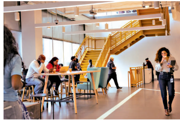
▲Meta計劃裁員約10%，並將更多資源集中到AI領域。

儘管公司高層反覆強調AI轉型的必要性，Meta內部仍出現抗議。超過1000名員工簽署請願書，公開反對管理層的監控與裁員計劃，認為公司近期引入鼠標追蹤工具來訓練AI，等於讓員工幫助公司設計可替代自己的機器人。