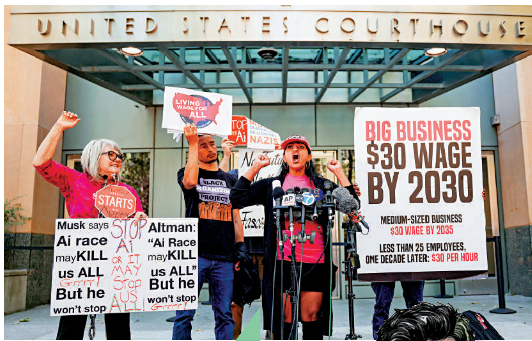
▲示威者5月14日聚集在審理馬斯克訴OpenAI案的法庭外，抗議美國科技巨頭唯利是圖。