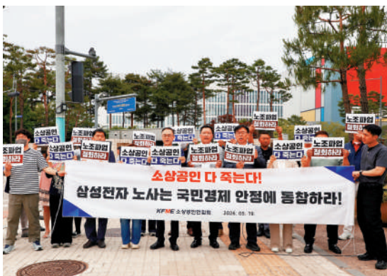
▲三星電子芯片工廠附近的小商戶19日舉行示威，呼籲三星電子工會取消罷工。網絡圖片

【大公報訊】綜合韓聯社、《朝鮮日報》報道：韓國三星電子工會計劃於21日展開為期18天的罷工，勞資雙方19日與中央勞動委員會（勞委會）進行罷工前的最終協商。勞委會委員長朴洙根（音）表示，目前仍有達成協議的可能，分歧正在縮小。