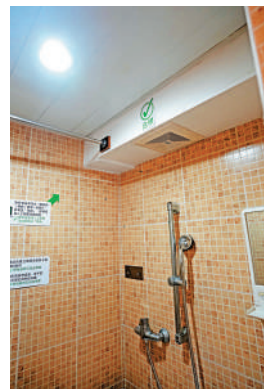
每個分間單位設有獨立廁所，並設有抽氣扇。