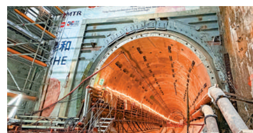
▲東涌綫延綫東涌西站及隧道建造工程正火速進行。

工程亦包括由現有東涌站向西延伸約1.3公里的兩條隧道，其中往東涌西站方向的隧道已完成建造，正進行內部基建工程，軌道鋪設工作稍後展開；而往東涌站方向的隧道正在鑽挖，已完成超過一半，預計下季完成。