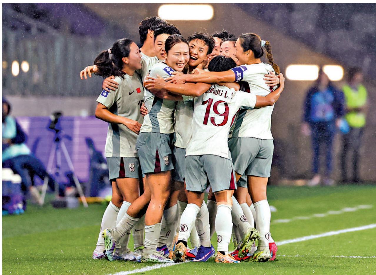
▲中國女足在3月的女足亞洲盃闖入4強。資料圖片

帶領中國隊打進了四強，同時獲得2027年巴西世界盃參賽資格。中國女足在亞洲盃小組三連勝晉級八強，八強又以2:0擊敗中國台北晉級四強，可惜在四強以1:2不敵東道主澳洲隊，未能蟬聯冠軍，但隊伍的精神面貌和拚勁獲得了好評，而米利西奇的領軍能力亦得到肯定。