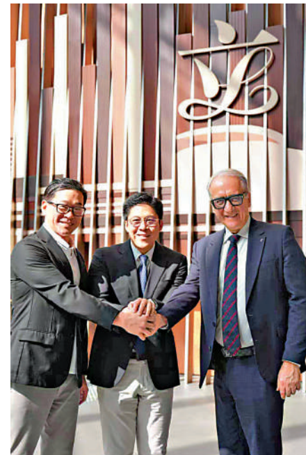
▲今次國際龍舟聯合會落戶，由中國香港龍舟總會同仁的推動，以及立法會議員霍啟剛（中）的協助。

的全球影響力。IDBF表示，隨着總部在港運作，將立即啟動未來三年戰略布局，重點優化世界競賽體系及推進青少年運動發展。