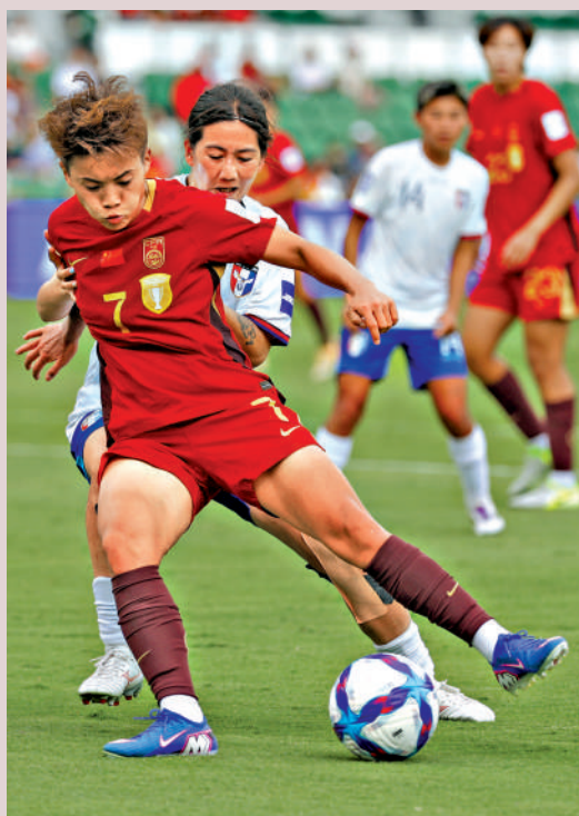
▲中國女足主力王霜（前）。資料圖片