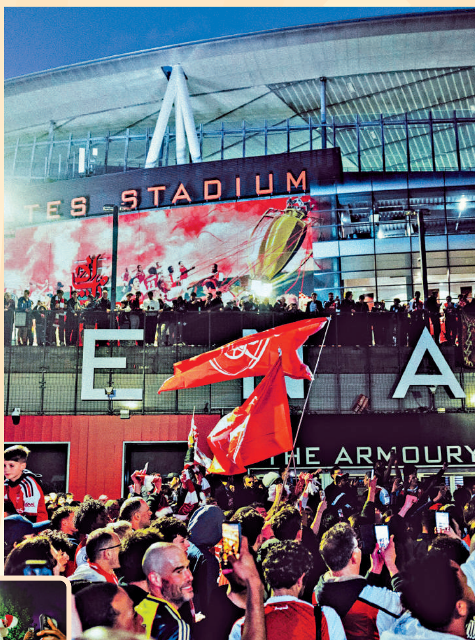
▲阿仙奴球迷在確認提早奪冠後，立即趕到酋長球場開慶祝派對。