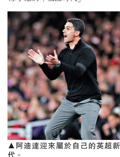
▲阿迪達迎來屬於自己的英超新時代。

7季下來，阿迪達麾下的阿仙奴從排名英超第8，之後升上第5，近3季連續3次獲得亞軍，巧合地與1999至2001年度連續3季奪亞相似，當時球隊在2001至02年度球季登頂，沒料到今季歷史重演，同樣在3亞後終於登上寶座。這段期間，阿迪達領軍246場英超取得148場勝利，共獲492個積分，同期僅次於哥迪奧拿。隨著沙比阿朗素執教車路士，曼聯勢必將卡域克升正主帥之位，英超未來將步入多隊爭冠的「戰國時代」。