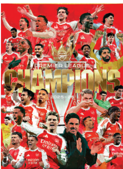
▲阿仙奴在官方社交平台發布奪冠海報。