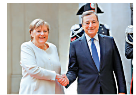
2021年10月，時任意大利總理德拉吉（右）在羅馬會見時任德國總理默克爾。

與俄方談判。普京曾表示，他願意與歐方進行對話，前提是代表「沒有說過任何詆毀俄羅斯的話」。