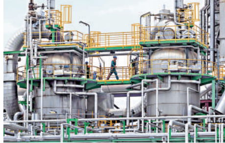
區危。中東戰事加劇歐洲能源危機。圖為德國煉油廠。

2025年的1.5%放緩至2026年的1.1%。歐盟委員會主席馮德萊恩上個月稱，美國和以色列對伊朗開戰，已導致歐盟的能源開支額外增加了220億歐元。