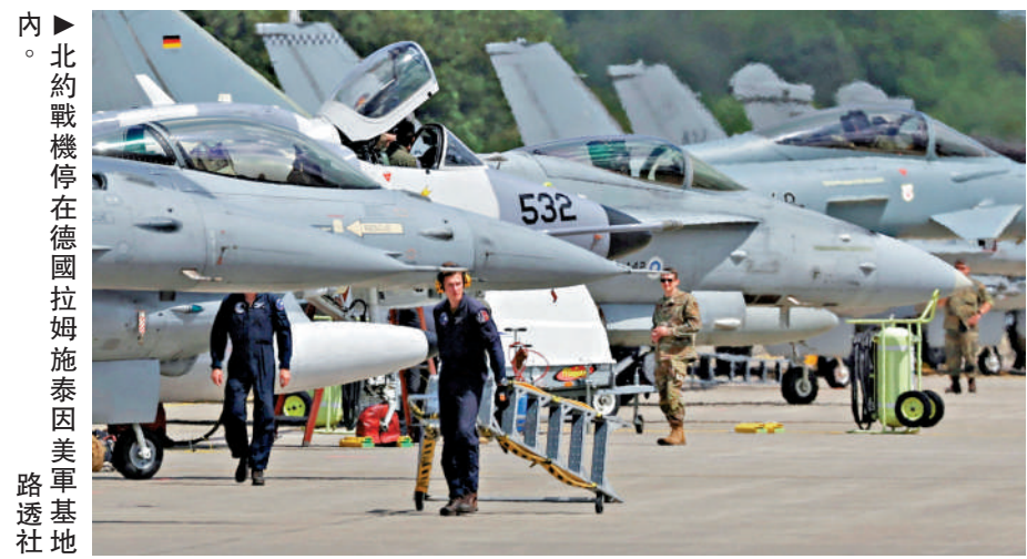
內。北約戰機停在德國拉姆施泰因美軍基地。

英媒20日引述3名知情人士報道，特朗普政府本周將告知北約盟友，美國將縮減在發生重大危機時可用於協助北約歐洲成員國的軍事力量儲備。五角大樓本月初宣布，將從德國撤出約5000名美軍人員。美國防部19日表示，已將美軍駐歐洲的旅級戰鬥隊總數從4個縮減至3個。部分歐洲國家擔心，美國可能最終全面撤出歐洲安全體系。