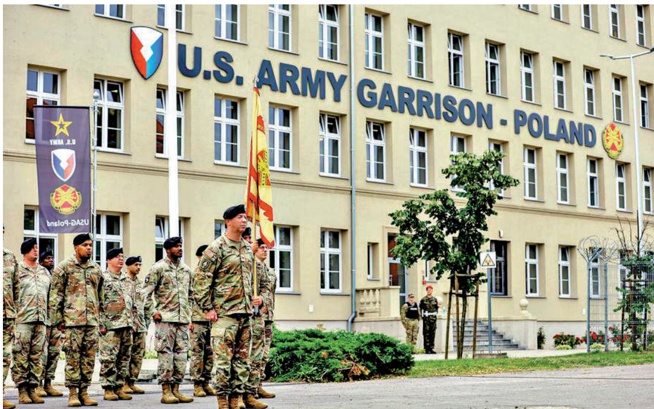
美國陸軍在波蘭科希丘什科營美軍基地舉行指揮權交接儀式。

評論認為，歐洲因長期過度依賴美國的軍事保護，導致其距離「國防自主」這一目標路途遙遠。呂特1月曾表示，歐洲如果完全實現國防自主，各國國防開支佔GDP的比例，將不得不增至10%，遠高於特朗普要求的5%，並且還須建立自己的核能力。