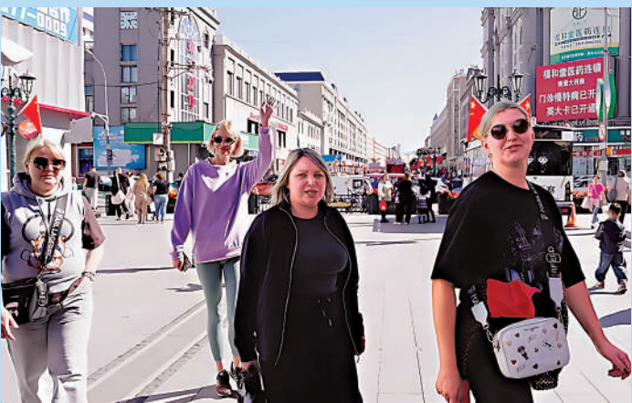
◀在與俄羅斯隔江相望的中國黑河，每天有大量俄羅斯遊客觀光消費。