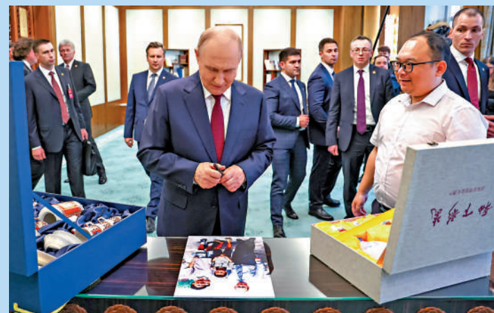
▲20日，在北京人民大會堂，26年前在北京偶遇俄羅斯總統普京並合影的彭湃（右）與普京互贈禮品。