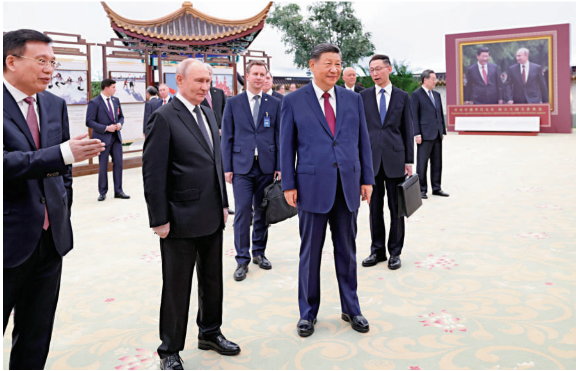
▲5月20日晚，國家主席習近平同俄羅斯總統普京在北京人民大會堂共同參觀「傳承中俄世代友好 樹立大國關係典範」圖片展。