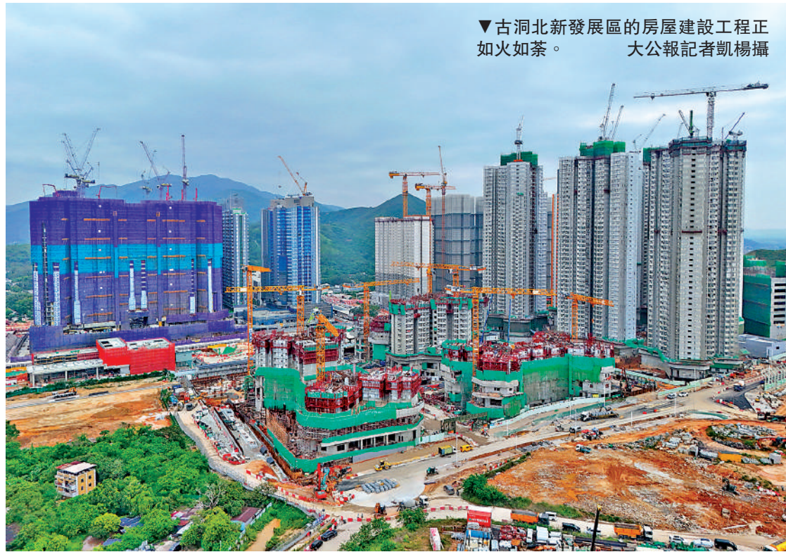
▼古洞北新發展區的房屋建設工程正如火如荼。

多名議員建議將提升居住面積的理念擴展至全港。立法會議員黃浩明認為，北部都會區作為