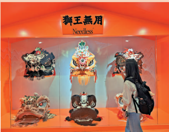
▲「獅王無用」將當代服飾設計注入醒獅文化之中。