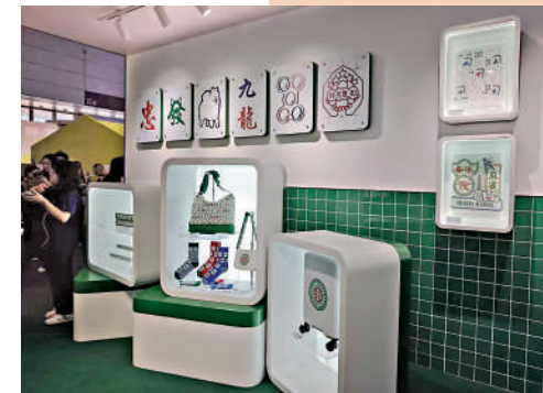
▲香港品牌一筒展示麻將主題的文創產品。