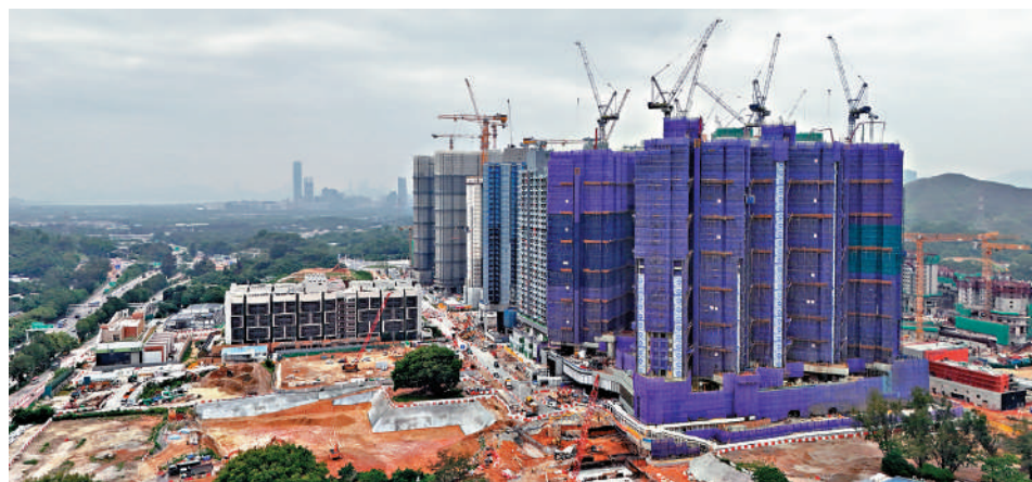
▲立法會昨日通過「幸福北都」議案，將從三方面着手，完善生活配套，吸引人才定居。圖為古洞北新發展區。