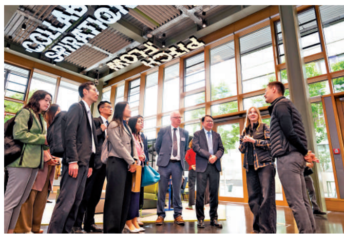
▲政務司司長陳國基率領「大學城籌劃及建設組」代表團到訪德國大學城，並參觀校園內的創業與共同創新中心。

【大公報訊】記者龔學鳴報道：政務司司長陳國基率領的「北都發展委員會」轄下「大學城籌劃及建設組」代表團，20日完成在德國的訪問行程。代表團重點考察了海爾布隆教育校園，借鑒其產學研融合及大學城發展的成功經驗，為北都大學城的規劃與定位尋找實踐啟示。