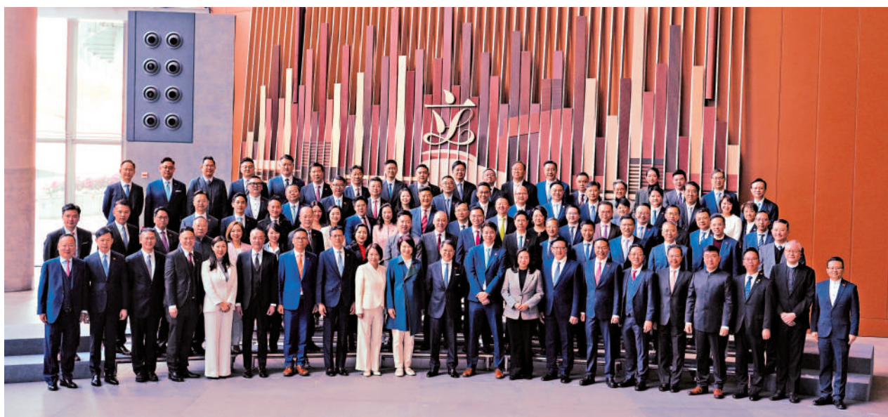
▲立法會全體議員將於7月19日至25日，到北京參加國家事務研修考察。圖為今年1月1日全體議員宣誓就職後合照。

翻查資料，上一屆立法會亦曾透過實地考察加深對國家最新發展的了解。2023年4月，行政長官李家超親自帶隊，率領逾80位立法會議員及政府官員前往深圳、東莞、佛山、廣州等大灣區城市進行為期四天的考察，走訪創科企業、文化設施等，當時李家超形容考察團規格最高、規模最大，體現了「愛國者治港」下行政立法的良性互動。