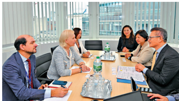
▲財政司司長陳茂波在比利時會晤歐盟委員會的代表，就經濟、金融、商貿等多方面交流經驗。

他也拜會了中華人民共和國駐歐盟使團團長、特命全權大使蔡潤，以及中華人民共和國駐比利時王國特命全權大使費勝潮，就中歐關係和香港的最新發展情況深入交流。