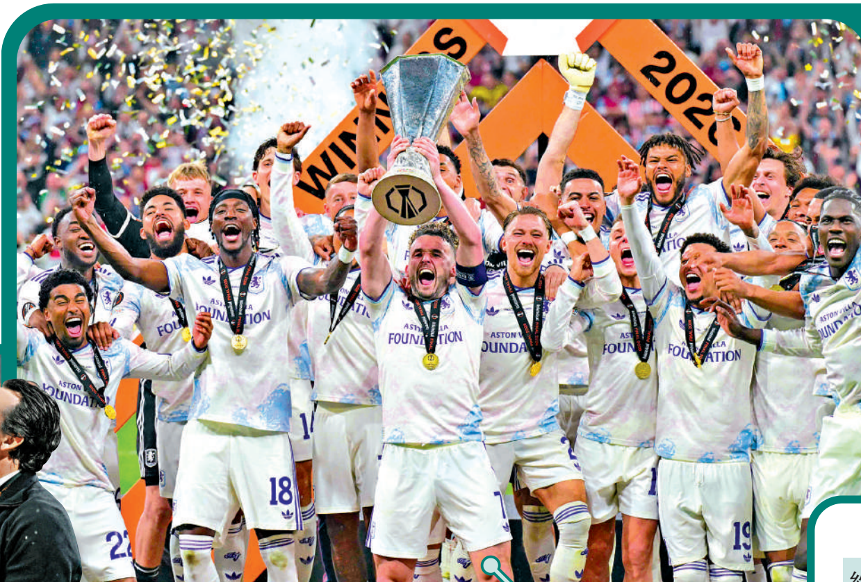
▲艾馬利個人第5次稱冠歐霸盃。