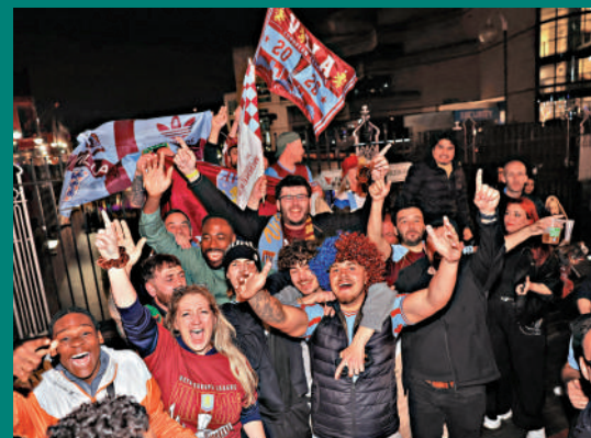
▲維拉奪冠後，大批球迷在場外慶祝。