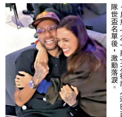
▲尼馬（左）與女友得悉入選巴西世盃名單後，激動落淚。

安帥又向尼馬講解巴西隊目前的新管理制度，特別是有關紀律行為的團隊要求，最後一項要求便是尼馬減少社媒使用頻率，以降低外界對巴西的干擾，讓全隊專注於備戰中。據聞尼馬願意適應新體系，成為體系中的功能角色，努力為再次征戰世界盃做好準備。