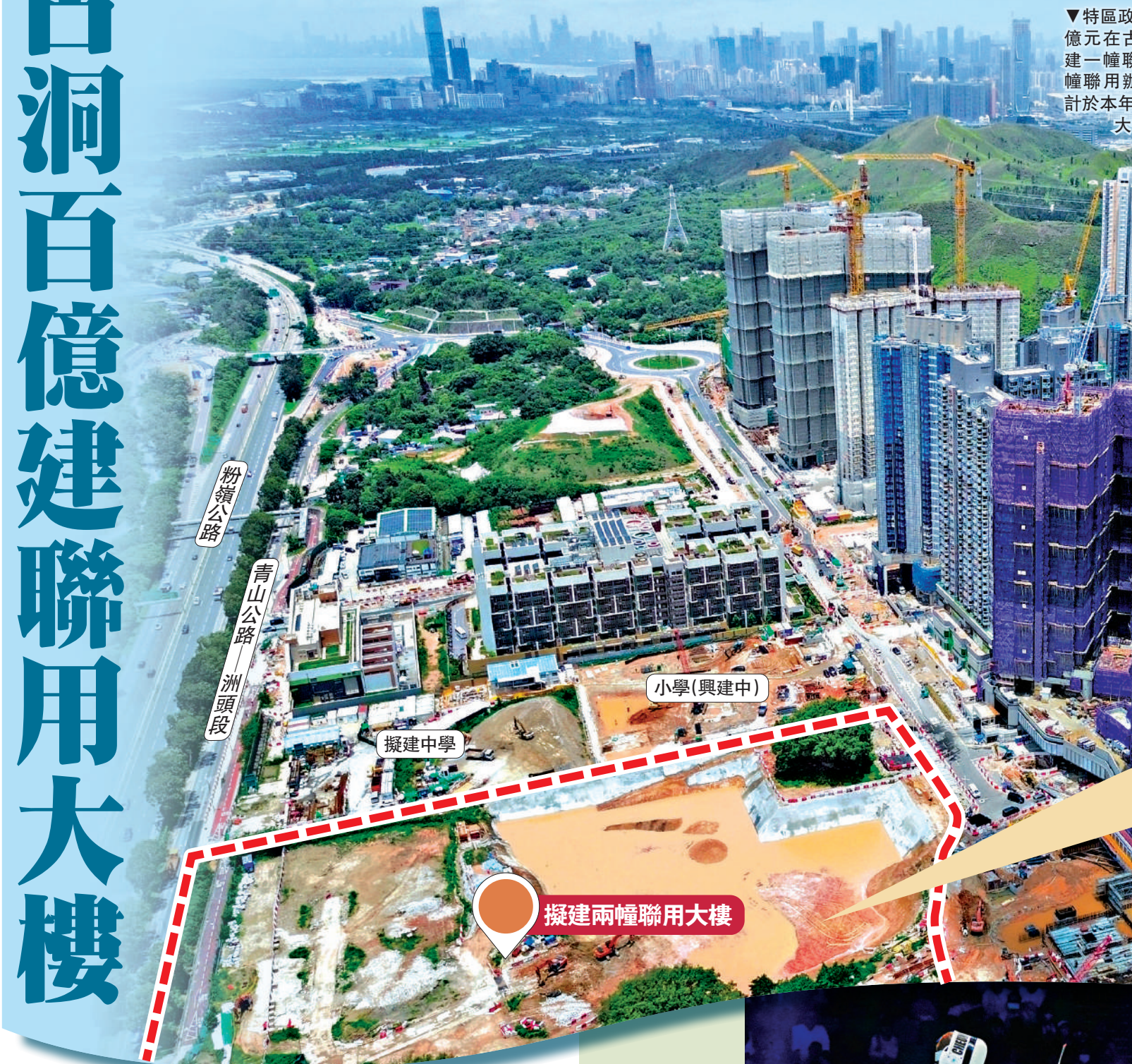
▼特區政府計劃斥資近100億元在古洞北新發展區興建一幢聯用綜合大樓及一幢聯用辦公大樓，工程預計於本年第三季展開。