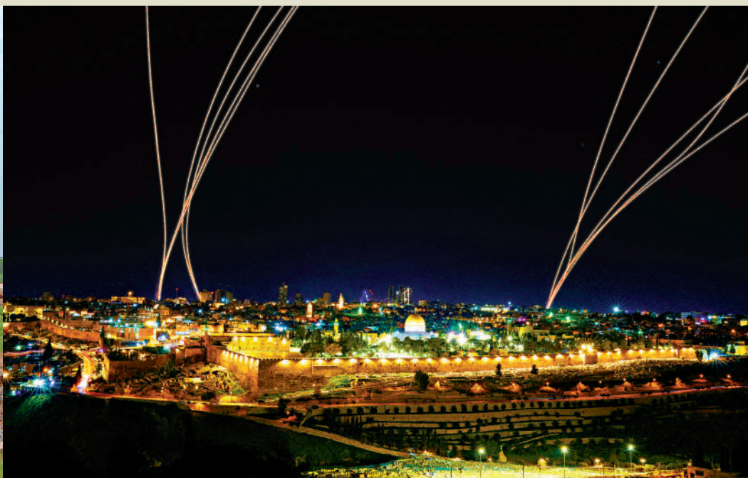
以色列「鐵穹」防空系統攔截伊朗發射的導彈。