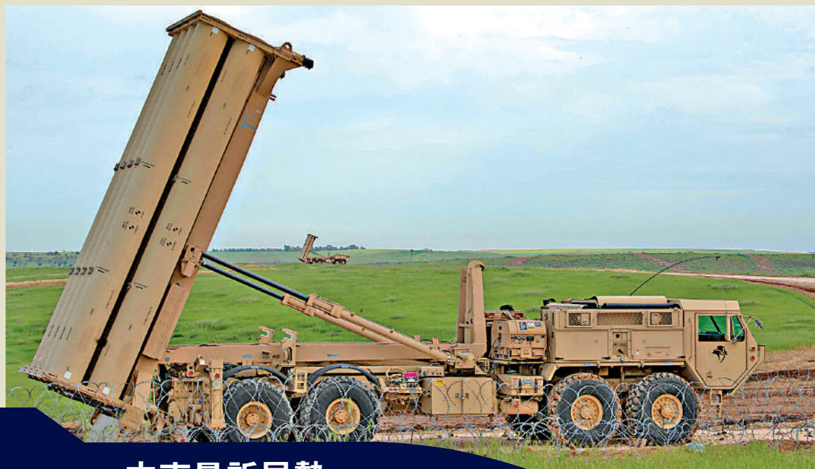
圖為美國僅剩約200枚「薩德」反導系統攔截彈。