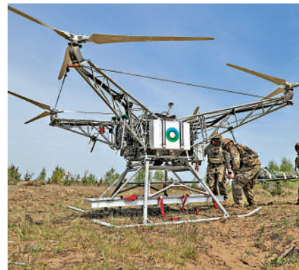
▲ 美軍士兵5月中旬參與在波蘭舉行的北約軍演。

防部官員表示：「過去兩周我們一直忙於應對此暫停（向波蘭）派兵的命令，現在我們也不知道怎麼做。」