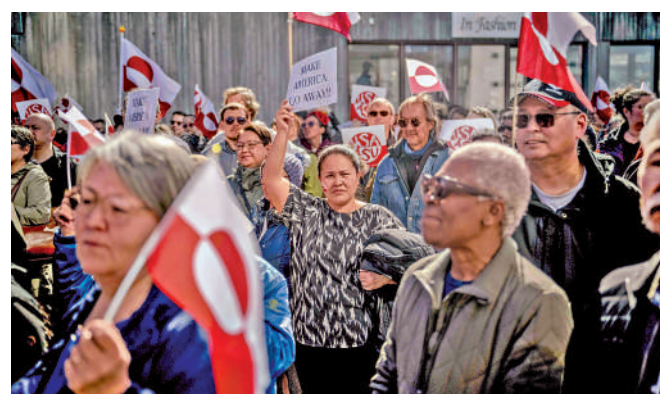
▲ 格陵蘭島民眾21日在當地美國新領館外示威。

訪格陵蘭島。這是自去年12月被特朗普任命為格陵蘭特使以來，首次踏足該島。蘭德里在訪問結束後表示，美國需要恢復在格陵蘭島的存在，格陵蘭島也需要美國。