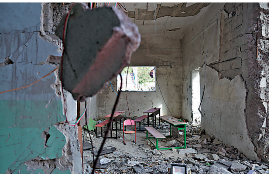
▲ 5月21日，遭美軍襲擊的伊朗米納卜市女子小學滿地狼藉。