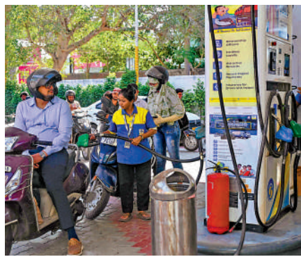
▲ 伊朗戰事加劇全球能源危機。圖為電單車手在印度一個加油站加油。

爾21日表示，隨着夏季燃料需求高峰來臨，若供應得不到改善，全球石油市場可能在今年7月至8月進入「紅色警戒區」。