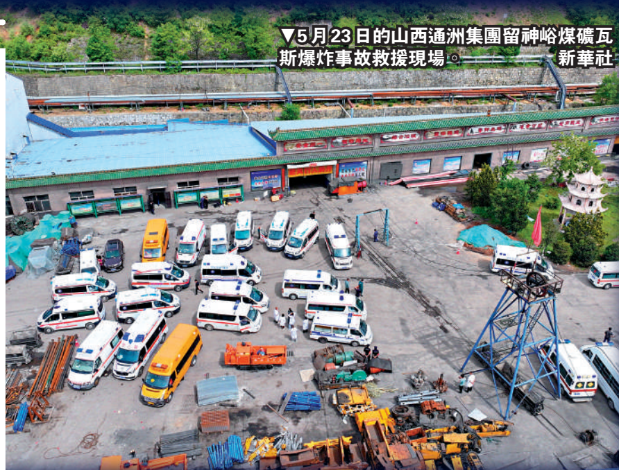
▼5月23日的山西通洲集團留神峪煤礦瓦斯爆炸事故救援現場。