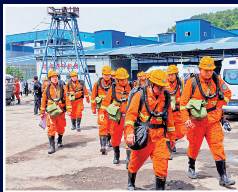
▲5月23日，救援人員在山西通洲集團留神峪煤礦礦難現場。