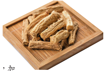
▲黨參具健脾益肺、養血生津之功效。

材料：黨參15克，黃芪20克，龍眼肉10克，酸棗仁15克，紅棗數枚，瘦肉200克，生薑數片。 做法：瘦肉切塊焯水；其餘材料洗淨。全部放入鍋中，加水適量，大火煮沸後轉文火煲1.5小時，調味即成。 功效：補氣養血，寧心安神。