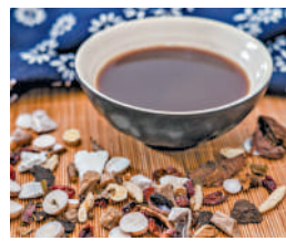
▲酸棗仁茶有助於養心安神。