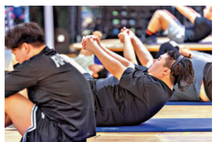
▲學員在浙江省湖州市長興縣一家「減重營」上運動燃脂課。 新華社

【大公報訊】據新華社消息：「腎性高血壓」，是繼發性高血壓的一種，主要由腎臟病或腎血管病變引起。鄭州大學第一附屬醫院血液淨化中心主任王沛表示，確診腎性高血壓後，首要任務是治療腎臟病，「腎臟病問題解決了，血壓有機會恢復正常，或者更容易控制下降。」他續稱，腎性高血壓發病無年齡限制，但在「青年高血壓」患者中更為常見。對於青年高血壓患者來說，血壓升高，就要警惕並優先排除腎性高血壓。若