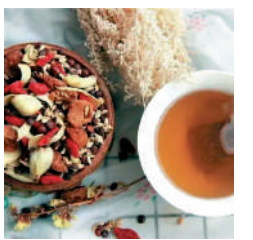
▲中醫以歸脾湯應對心脾兩虛證。

材料：茯苓20克，白朮15克，陳皮5克，生薑數片，瘦肉200克。 做法：瘦肉切塊焯水；其餘材料洗淨。全部材料放入鍋中，加水適量，大火煮沸後轉文火煲1.5小時，調味即成。 功效：健脾祛濕，和中止瀉。