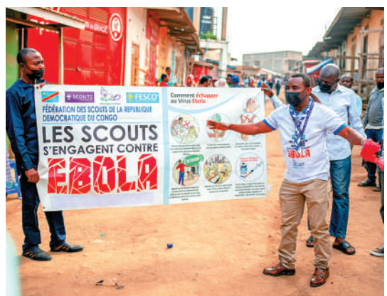
▲5月23日，剛果(金)童軍組織成員在街頭進行伊波拉防疫宣傳。

中國駐烏干達使館、駐中非使館22日均提醒當地中國公民密切關注疫情發展動態，增強防範意識，加強個人衛生防護。中國駐科特迪瓦使館提醒在科中國公民密切關注疫情動態，加強個人防護。科特迪瓦及其他西非國家境內目前尚無