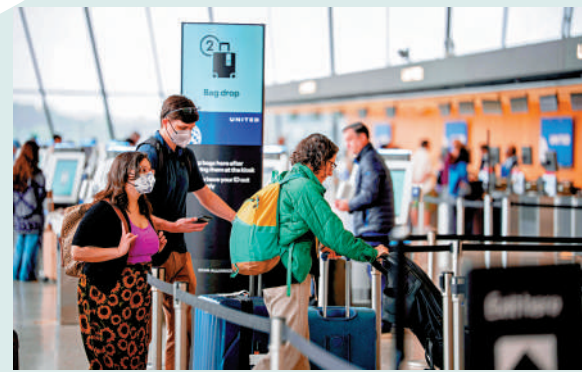
▲美國收緊對伊波拉疫情相關國家的防疫措施。旅客22日在華盛頓杜勒斯國際機場排隊辦理登機手續。

美加墨世界盃即將開幕，正在比利時備戰的剛果(金)國家隊能否順利進入美國參賽引發關注。白宮世界盃工作小組執行主任朱利安尼表示，美方已通知國際足聯(FIFA)、剛果(金)國家隊以及剛果(金)政府，要求球隊繼續留在比利時的封閉訓練環境中隔離21天，才能在6月11日前往美國休斯敦參加小組賽。美國政府稍早前稱，剛果(金)國家隊可獲豁免入境防疫限制。(綜合報道)