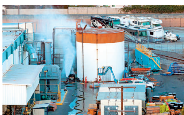
▲美國加州一家航天工廠裝有化學品的大型儲罐21日發生洩漏事故，消防員正進行處理作業。

奧蘭治縣消防局局長科維表示，罐體可能會裂開並釋放化學物質，或者爆炸並引發連鎖反應。當局目前尚不清楚事故何時結束。工作人員已用沙袋搭建了隔離屏障，以阻止有毒化學品在爆炸後流入雨水排水溝或溪流及附近的海洋。美國環境保護署已在工廠周邊部署設備監測空氣中的化學物質濃度。