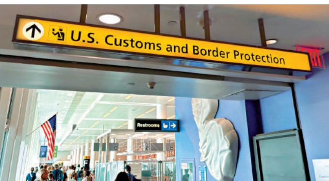
▲美國明尼蘇達州明尼阿波利斯機場的海關和邊境保護局(CBP)辦公室。

【大公報訊】綜合美聯社、路透社報道：美國特朗普政府進一步收緊移民政策，移民部門22日宣布，要求希望獲得永久居留(即綠卡)的在美外國人返回原籍國，在境外提交申請。