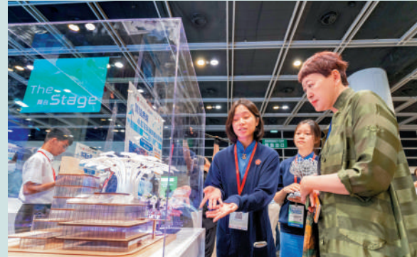
▲作為「氫能周」科普系列活動之一，「氫建未來·小花科創向善挑戰賽」展示了一件件充滿創意的學生作品。