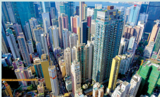
▲市民置業通常申請按揭，但有部分銀行可能拒絕批核。