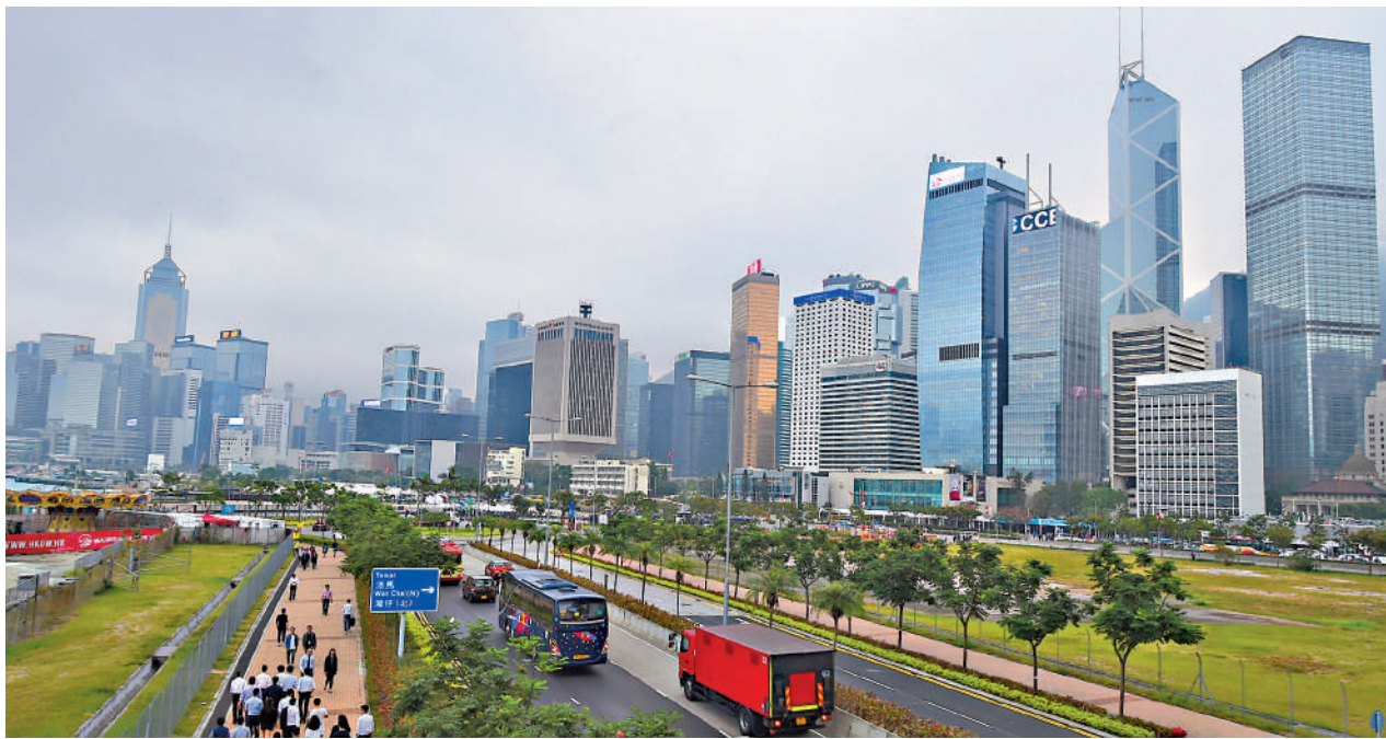
▲國家「十五五」規劃綱要明確支持「強化香港全球離岸人民幣業務樞紐」。