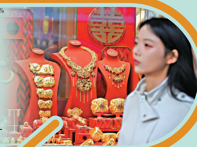
香港打造黃金交易中心，帶動黃金珠寶產業鏈及零售業升級。