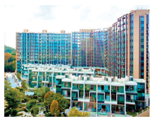
▲ 元朗山水盈33號洋房於去年底遭撥訂，將被安排周三招標出售。

2311方呎，原於2021年9月以3915.35萬元售出，當時買家選用1100天成交期付款計劃，並享先住後付，然最終在去年12月底決定放棄完成交易。