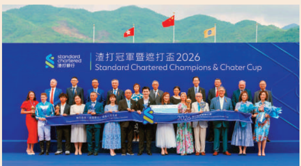
▲ 今年是渣打連續第17年冠名贊助「渣打冠軍盃盃盃」。

今年是渣打連續第17年冠名贊助「渣打冠軍盃盃盃」。渣打香港兼大中華及北亞區行政總裁禰惠儀表示，適逢睽違3年的渣打投資者活動剛於香港舉辦，超過300名賓客齊聚一堂，一同見證浪漫勇士成為香港歷來第3匹三冠王，為香港賽馬史