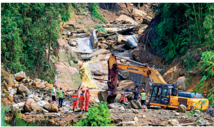
▲24日，救援人員在重慶永川現場工作。