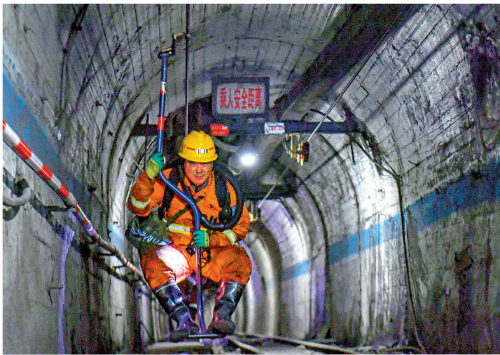
▲23日夜夜，在山西通洲集團留神峪煤礦瓦斯爆炸事故救援現場，在井下搜救已超10個小時的救援人員上井。