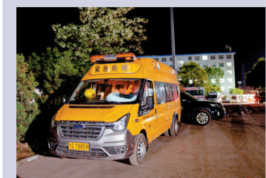
▲24日凌晨，救援人員在沁源縣煤礦事故救援現場休息。