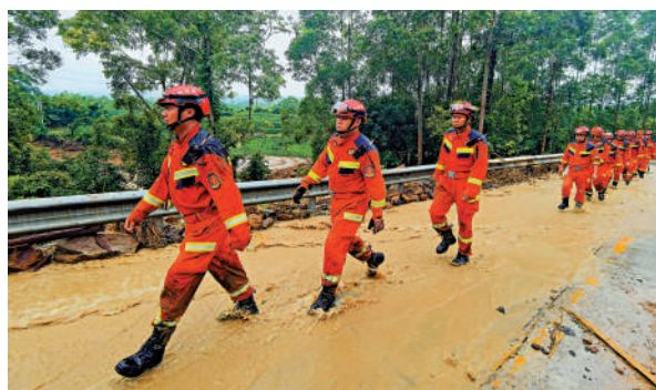
▲24日，救援人員在重慶永川步行前往救援現場。