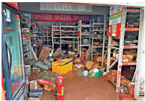
▲永川區永鋼村有菜鳥驛站和快遞驛站被淹。

大公報記者見到，永川區永鋼村菜鳥驛站和快遞驛站被淹，大量快遞盒浸泡在黃褐色的泥漿裏。店內的積水漫過了貨架的底層，紙箱歪歪扭扭地浮著、泡著，原本整齊碼放的包裹散在水裏，泡得發脹。快遞站工作人員告知，特大暴雨致跳石河漲水，河邊的永鋼村商舖基本被淹，店內2000多個快遞全部被洪水泥漿浸泡，預計損失數萬元人民幣。目前正在向公司匯報情況，希望不要被罰款。