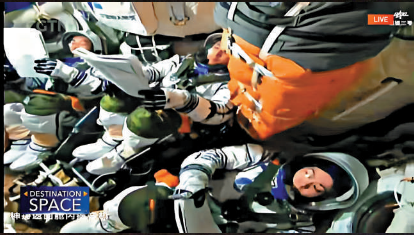
◀神二十三號載人飛船與火箭成功分離，進入預定軌道，航天员乘組狀態良好。圖為航天员在艙內工作。

神舟二十三號載人飛行任務航天员乘組出征儀式，24日在酒泉衛星發射中心問天閣圓夢園廣場舉行。20時18分，朱楊柱、張志遠、黎家盈3名航天员領命出征。空間站應用與發展階段飛行任務總指揮部有關領導和成員、航天科技人員、各族群眾代表，以及香港特區政府、科創界和青年學生代表在現場為航天员乘組壯行。