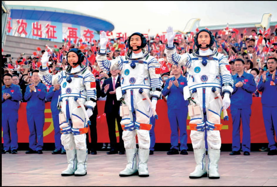
▲神舟二十三號航天员乘組出征儀式昨晚在酒泉衛星發射中心問天閣圓夢園廣場舉行。這是航天员朱楊柱（右）、張志遠（中）、黎家盈在出征儀式上。