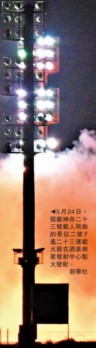
◀5月24日，搭載神舟二十三號載人飛船的長征二號F遙二十三運載火箭在酒泉衛星發射中心點火發射。