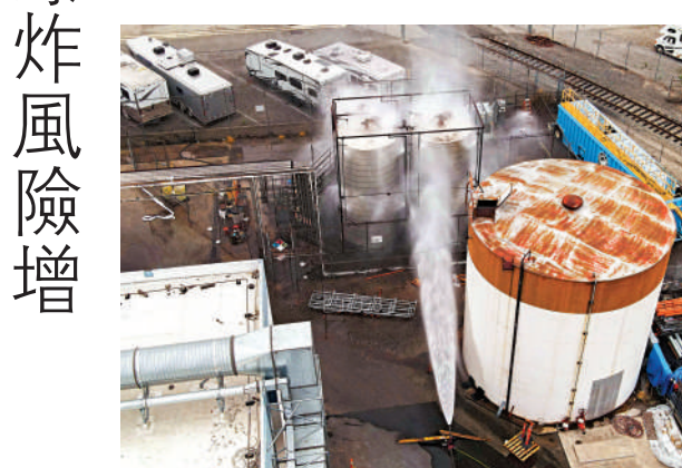
▲加州消防員23日向一個化學品儲罐噴水進行降溫工作。

加州州長紐森宣布奧蘭治縣進入緊急狀態，向地方機構提供州級資源，並允許在必要時將州屬房產和展覽場地用作避難所。據報道，周邊地區強制疏散範圍正在擴大，預計影響人數從約4萬增至約5萬。