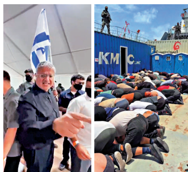
▲在以色列國家安全部長本-格維爾（左圖）20日發布的視頻中，數十名活動人士被拘留後被迫下跪、額頭貼地、雙手被縛。

以色列總理內塔尼亞胡亦罕有地公開批評本-格維爾，指其對待活動人士的方式「不符合以色列的價值觀和規範」。不過，內塔尼亞胡同時聲稱，該人道援助任務本身是「支持哈馬斯的惡意計劃」。