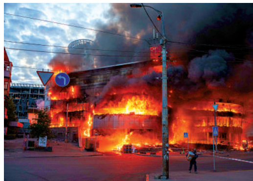
▲烏克蘭首都基輔24日凌晨遭到大規模空襲，多棟建築物起火。

【大公報訊】綜合BBC、法新社報道：俄羅斯國防部24日在聲明中表示，為回應烏克蘭對俄羅斯民用設施的「恐怖攻擊」，俄軍