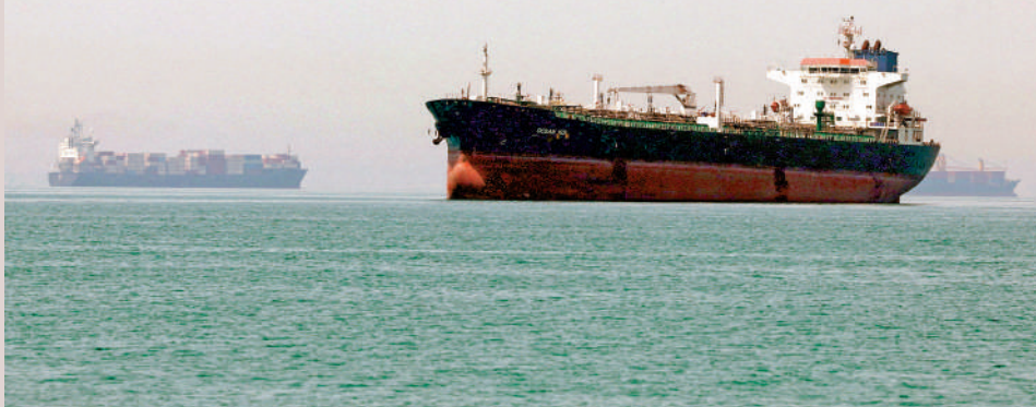
▼霍爾木茲海峽通航問題是美伊談判焦點之一。

「霍爾木茲海峽將重新開放」的說法「不完整」，即使達成協議，該海峽也將繼續由伊朗管理。儘管伊朗同意將允許通過海峽的船隻數量恢復到戰前水平，但這不意味海峽將恢復到戰前「自由通行」狀態。伊朗伊斯蘭革命衛隊海軍24日說，過去一天共有33艘船隻獲伊朗許可後通過該海峽。與此同時，美軍仍對進出伊朗港口的船隻開火警告，海上封鎖態勢未見鬆動。