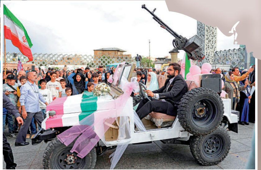
▼伊朗民眾18日舉行旨在展示愛國情懷的集體婚禮，新婚夫婦乘坐軍車。

伊朗軍方24日在該國南部擊落一架以色列無人機。伊朗伊斯蘭革命衛隊總司令瓦希迪強調，伊朗武裝力量目前保持「最高級別的戰備與威懾狀態」。