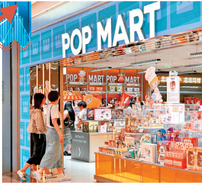
▲泡泡瑪特首季業績表現強勁，其業務前景值得看好。

多隻內需股首季經營數據優於市場預期，反映內地消費行業平穩向好。雖然4月份社會零售總額增長轉慢，但首4個月以舊換新政策拉動消費品銷售額6069億元（人民幣，下同），而2025年首5個月拉動銷售額為1.1萬億元，說明政策推高基數。暑假旺季前，市場預期內地將會出台刺激消費措施。 本周專家推介兩隻消費股，泡泡瑪特、蜜雪集團。內需股處於弱勢，期待借助刺激消費措施走出上行情。