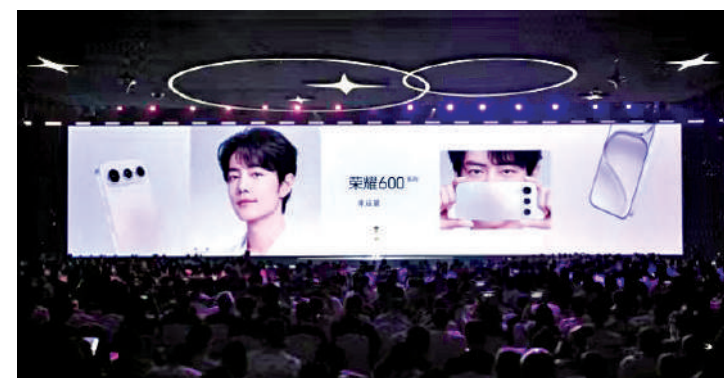
▲榮耀數字手機全球代言人肖戰助陣亮相。