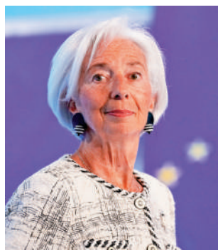
▲拉加德預告，歐央行將在下次會議上調通脹預測。資料圖片

儘管如此，貿工部仍維持2026年國內生產總值(GDP)增長率預估值在2%至4%不變，與今年2月上調後的展望一致。新加坡去年經濟增長率為5%，首季方面，GDP經季節調整後，較前一季增長1%，遠高於彭博預估的0.2%中值；按年增長則錄得6%，高於市場預期的5.2%。