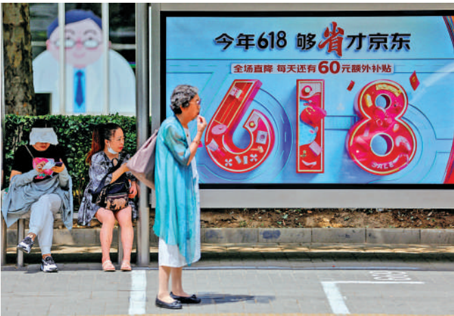
▲每年的「618」，內地各大電商平台都會推出促銷活動。