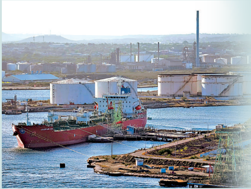
▲市場憧憬霍爾木茲海峽重開，國際油價下跌至近90美元。