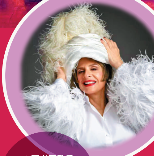
▲百老匯歌后 Patti LuPone 以《音樂人生》回望自己60年的舞台生涯。

卡巴萊(Cabaret)一般指在較親密、非傳統劇院空間進行的表演形式，結合音樂、歌唱、戲劇、舞蹈及即興互動等元素，常見於夜間場域，如酒館或小型劇場，強調現場氣氛與觀眾距離感。表演內容可以是獨唱、故事演繹、喜劇片段或混合式演出，形式相對自由。