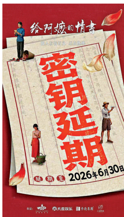
▲電影《給阿嬤的情書》宣布密鑰延期至6月30日。

在某電影評分網站上，超過69萬觀眾打出9.2高分，該片成為今年開分最高的國產電影。