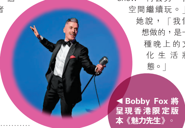
▲Bobby Fox 將呈現香港限定版本《魅力先生》。

余瑞婷坦言，香港過去較少以「卡巴萊文化」去理解表演藝術，但她希望，這次藝術節能夠讓觀眾慢慢建立新的觀看習慣。「你可以放工後過來，飲杯酒、睇半場show，再去另一個空間繼續玩。」她說，「我們想做的，是一種晚上的文化生活狀態。」