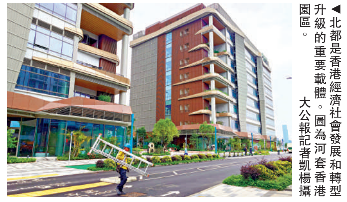
北都是香港經濟社會發展和轉型升級的重要載體。圖為河套香港園區。

北都的建設不能等，創科企業的成長不能等。但金融機構的思維轉變、早期資本缺口的填補、處理輕資產企業的融資需求——誰來解決？何時解決？這些問題的答案，將直接決定北都最終會成為「創科中心」，還是另一個只有住宅、沒有產業的「睡城」。