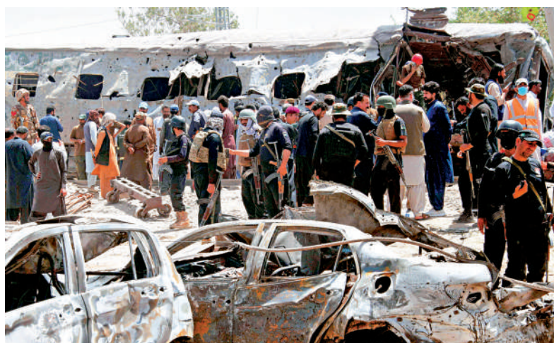
▲巴基斯坦俾路支省一列客運列車遭炸襲擊。