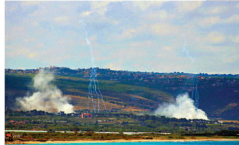
▲以軍25日再次空襲黎巴嫩南部地區。

伊協議得到「進一步增強」。 美國近年曾推動沙特與以色列關係正常化，但2023年10月巴以衝突爆發後沙特暫停相關談判。知情官員稱，鑒於當前中東緊張局勢及以色列將於幾個月後舉行議會選舉，沙特近期不太可能與以色列恢復談判。