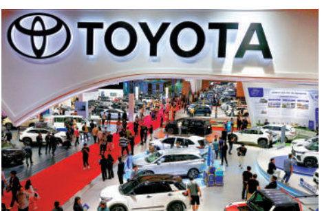
▲中東緊張局勢令豐田汽車蒙受損失。

劃。據悉，豐田將主要減少面向中東及亞洲市場的汽油車生產。3月至4月，豐田在日本國內生產、計劃出口至中東的汽車產量已削減約4萬輛。