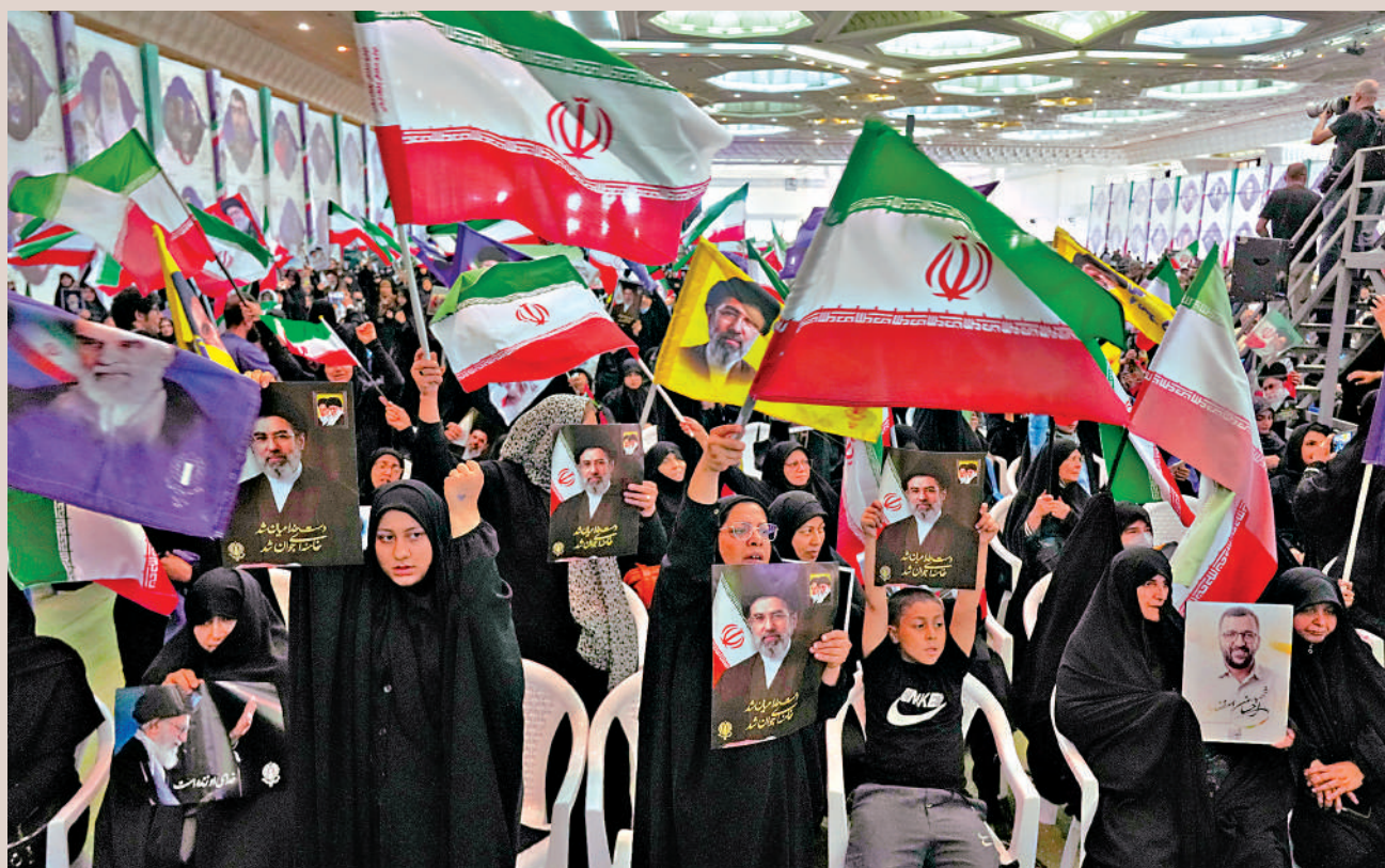
▲伊朗民眾24日參加支持政府、紀念在美以軍事行動中遇難者的集會活動。

伊朗媒體稱，伊美雙方均未在協議草案中就核問題作出任何約定。報道提及，草案內容包括結束黎巴嫩在內所有戰線的戰爭。然而，以色列25日再次宣布準備對黎巴嫩真主黨發動空襲，要求黎南部居民撤離。黎真主黨領導人卡西姆24日說，任何試圖解除該組織武裝的行為，都將導致真主黨被「消滅」、黎巴嫩被逐步佔領。