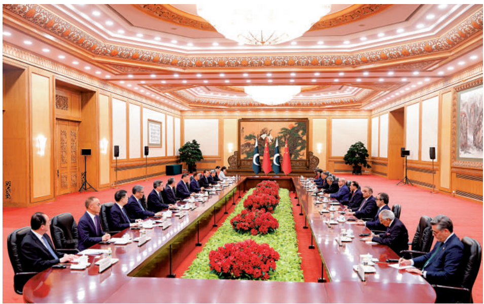
▲5月25日下午，國家主席習近平在北京人民大會堂會見來華進行正式訪問的巴基斯坦總理夏巴茲。

【大公報訊】據新華社報道：5月25日下午，國家主席習近平在北京人民大會堂會見來華進行正式訪問的巴基斯坦總理夏巴茲。