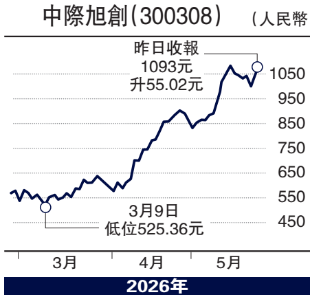
中國股市持續吸引資金流入，硬科技股成為投資首選，中際旭創今年大升75%，市值破萬億元。

中國製造業景氣持續好轉，高技術製造業訂單指數保持在53以上水平，其中儲能電池景氣甚佳，內外需求帶動下，行業持續提價及擴張產