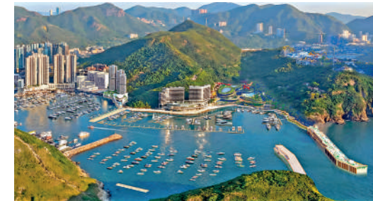
▲新防波堤及遊艇停泊設施構想圖。

發展局常任秘書長（規劃及地政）何珮玲表示，現時香港仔避風塘面積大約是60公頃，期望在避風塘南邊擴建24公頃，其中遊艇停泊設施佔用約11公頃，料能容納200艘遊艇。而當局有四個目標，期望增加泊位；增加防波堤等基建設施應對極端天氣；發展遊艇經濟，以及與海洋公園發揮協同效應。按付款當日價格計算，當局估計擬議工程計劃的建設費用約為20.3億元。