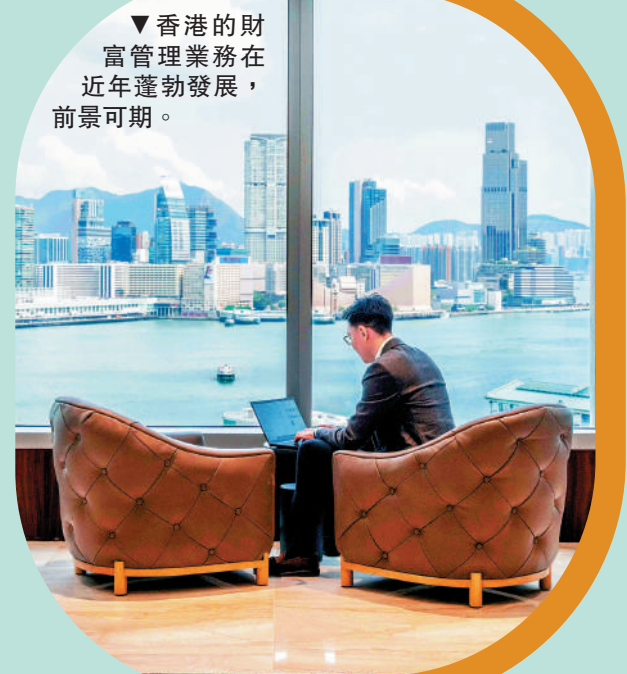
▼香港的財富管理業務在近年蓬勃發展，前景可期。