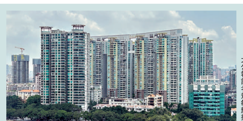
▲廣州「賣舊買新」試點工作是激活市場的交易模式創新。大公報記者敖敏輝攝