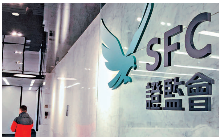
▲證監會表示，這次的諮詢總結標誌着完善數字資產監管框架的最後一步。